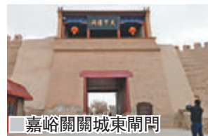
嘉峪關關城東閘門