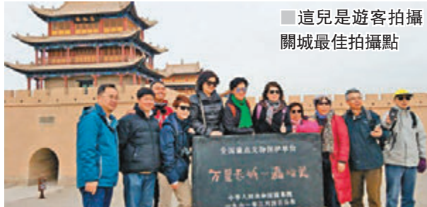
這兒是遊客拍攝關城最佳拍攝點