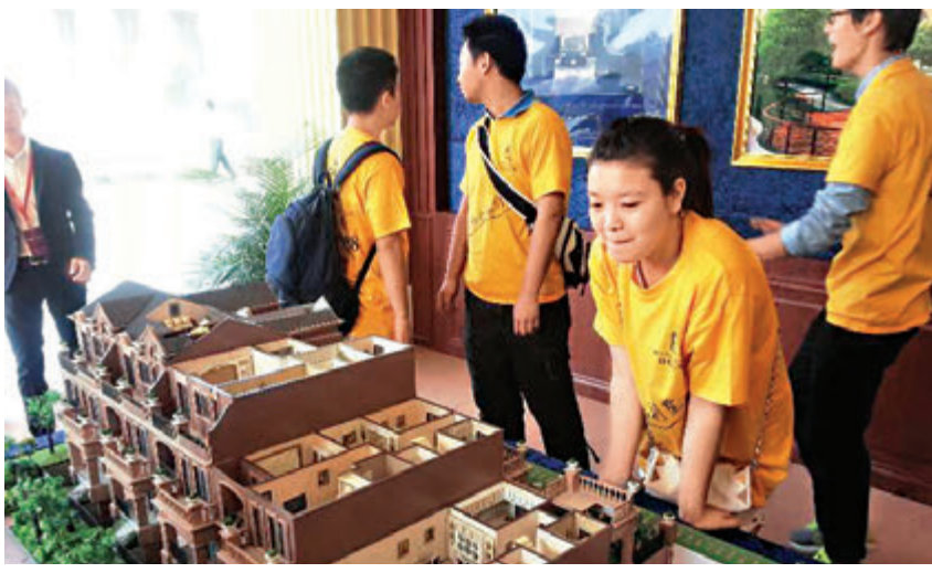
▲上月一线与二三线城市房价持续分化