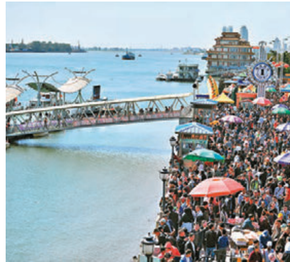
4月遼寧丹東新樓價格環比上漲2%,漲幅冠內地。圖為遊客在遼寧丹東欣賞中朝兩國風光。資料圖片

目前被約談城市多已出臺新調控措施,收緊樓市政策。嚴躍進表示,部分地區樓價反彈促使各類新的調控收緊,尤其是收緊性的購樓政策和政策打補丁的做法會增加。