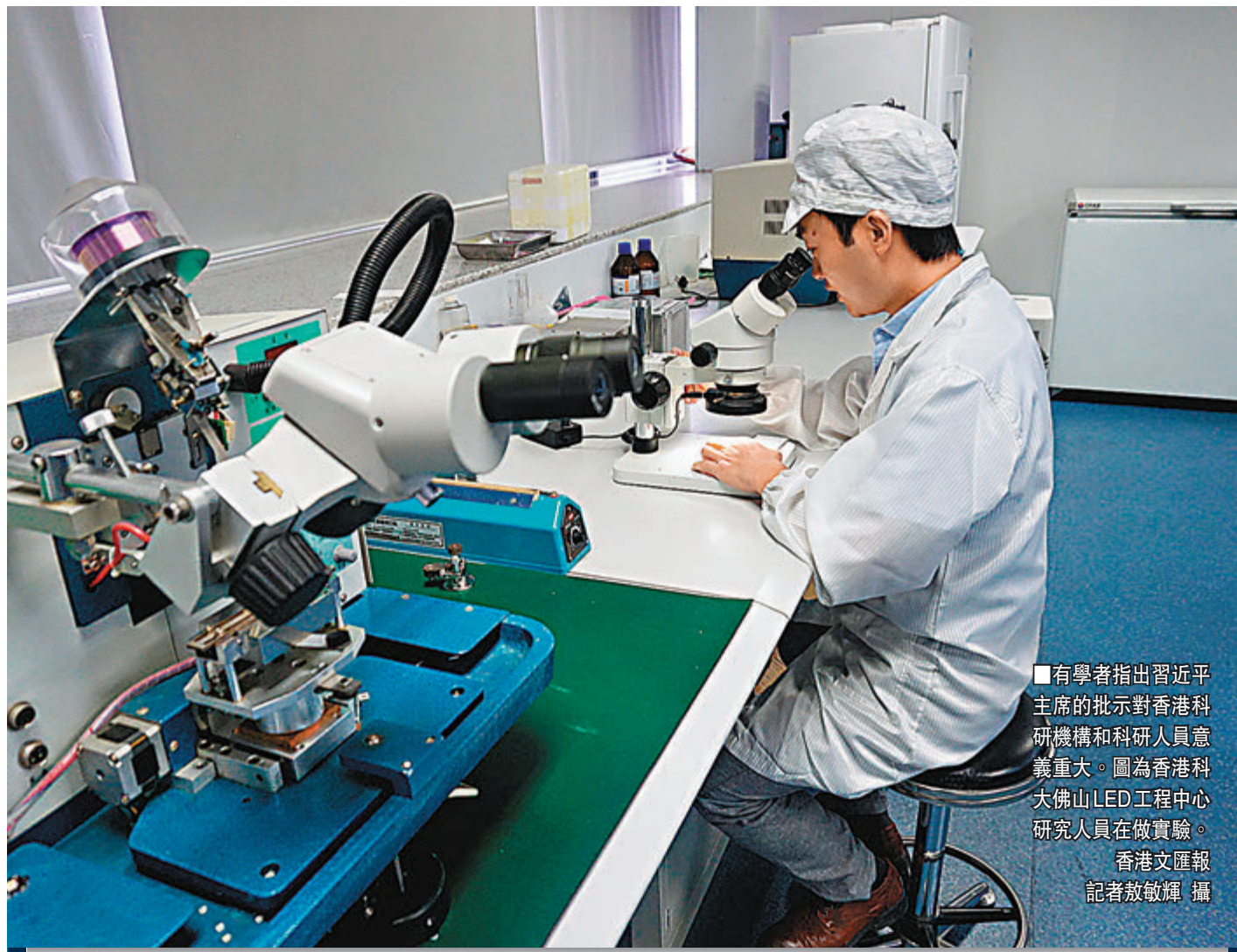
■有學者指出習近平主席的批示對香港科研機構和科研人員意義重大。圖為香港科大佛山LED工程中心研究人員在做實驗。

如今，內地科研經費可以入港，香港科學家也能把儀器帶入內地。周立兵說，就像是感受到了新時代的春風，未來香港和內地的科研合作將變得大有可期，至少能夠顯著提高雙方共同合作的積極性。他認為，目前內地發展日新月異，科研和科技成果转化方面發展越來越快，而香港的科技實力、管理制度都有其自身獨特的優勢，兩者能夠同步邁進，未來將大有可為。