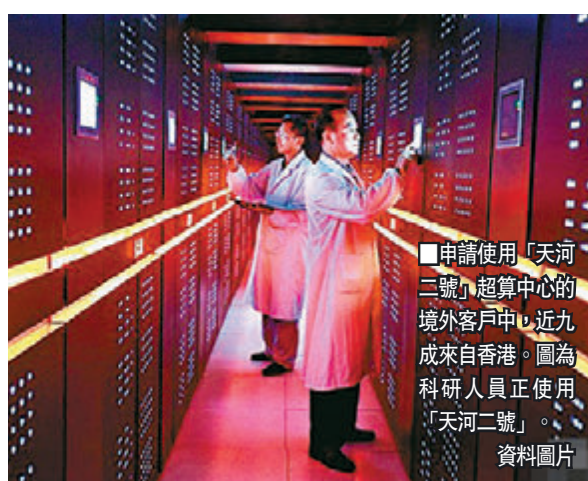
■申請使用「天河二號」超算中心的境外客戶中心，近九成來自香港。圖為科研人員正使用「天河二號」。

劉焯輝還表示，將以廣東省內自貿區為試點區，探索打通境內外創投市場，建設國際科技創新特區和我國產學研合作的新特區。