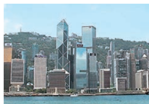
■分析員憂慮若日後樓價下跌及市場利率上升時，銀行資產質素或受影響。

外資行方面則見個別發展，因應英國脫歐、實施分區銀行等，不少券商料匯控日後非經常性成本將上升，有機會影響盈利表現，另有指匯控新班子擬繼續「瘦身」計劃，或削去25%地區業務。德銀發表報告認為，匯控雖然股息回報穩定，亦有潛在回購的可能，但目前估值不便宜及已反映增長前景。瑞銀亦同樣認為，渣打估值不吸引，同時面對收入增長轉弱的風險。