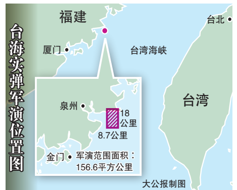
台海军演演习位置图 大公报制图