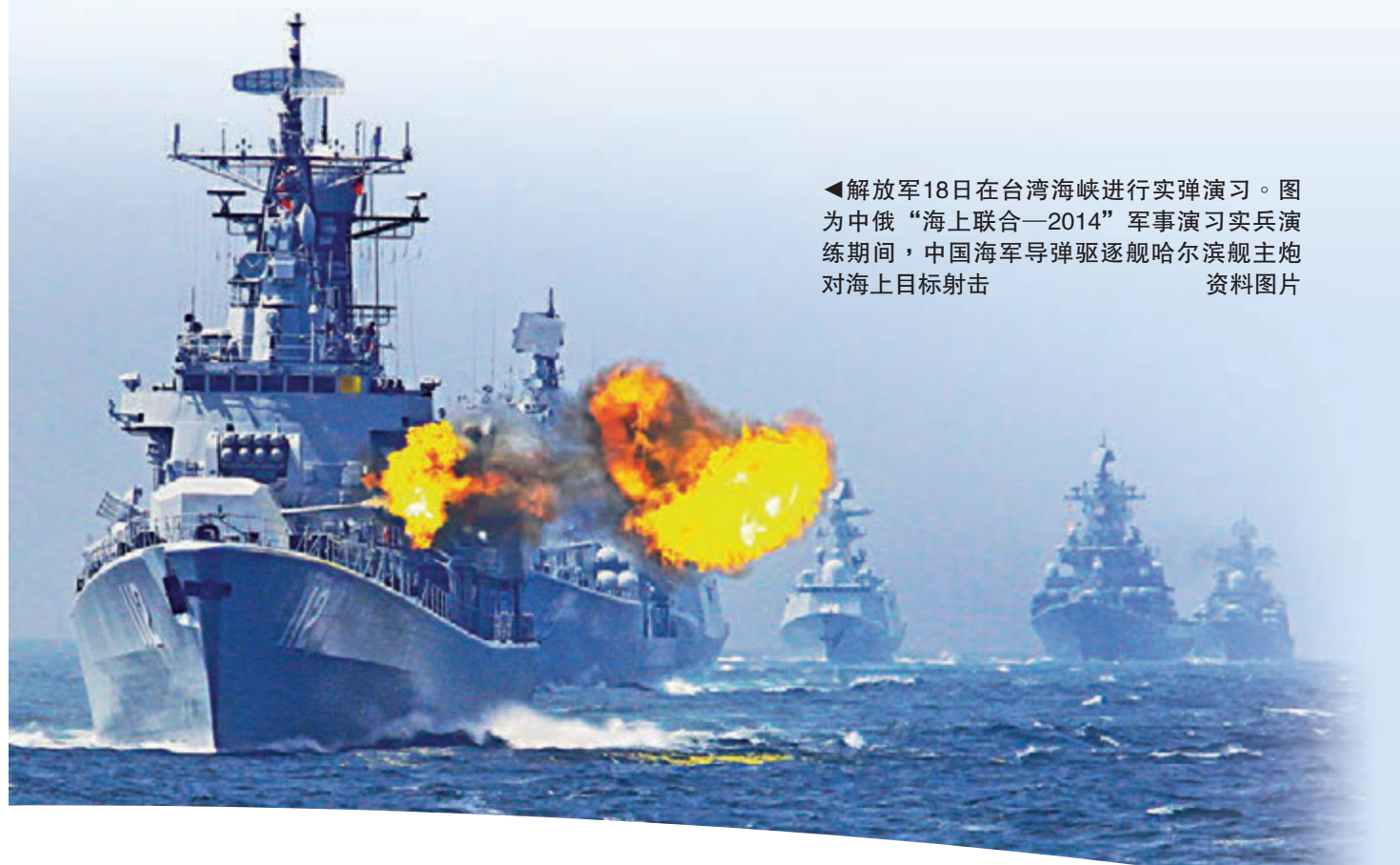
解放军18日在台湾海峡进行实弹演习。图为中俄“海上联合—2014”军事演习实兵演练期间，中国海军导弹驱逐舰哈尔滨舰主炮对海上目标射击 资料图片