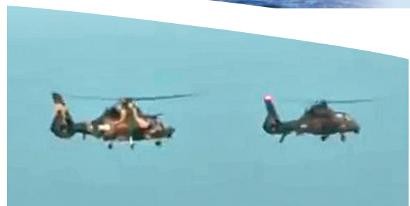
▲演习紧贴实战 网络图片