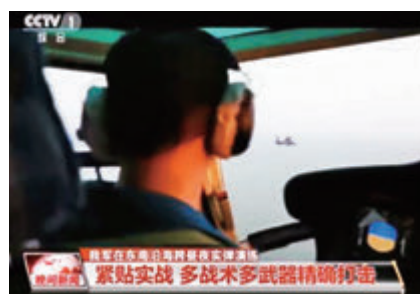
▲直升机进行侦察搜索