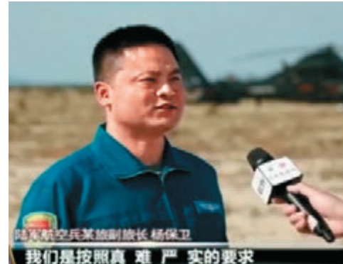
▲陆军航空兵某旅副旅长在军演现场接受采访 央视网

不过，谢智通也指出，尽管当前两岸关系趋于紧张，但是并未对台商在大陆的经营和两岸经贸往来造成冲击。他说，大陆把政治和经贸分开，大陆各地最近陆续落实“31