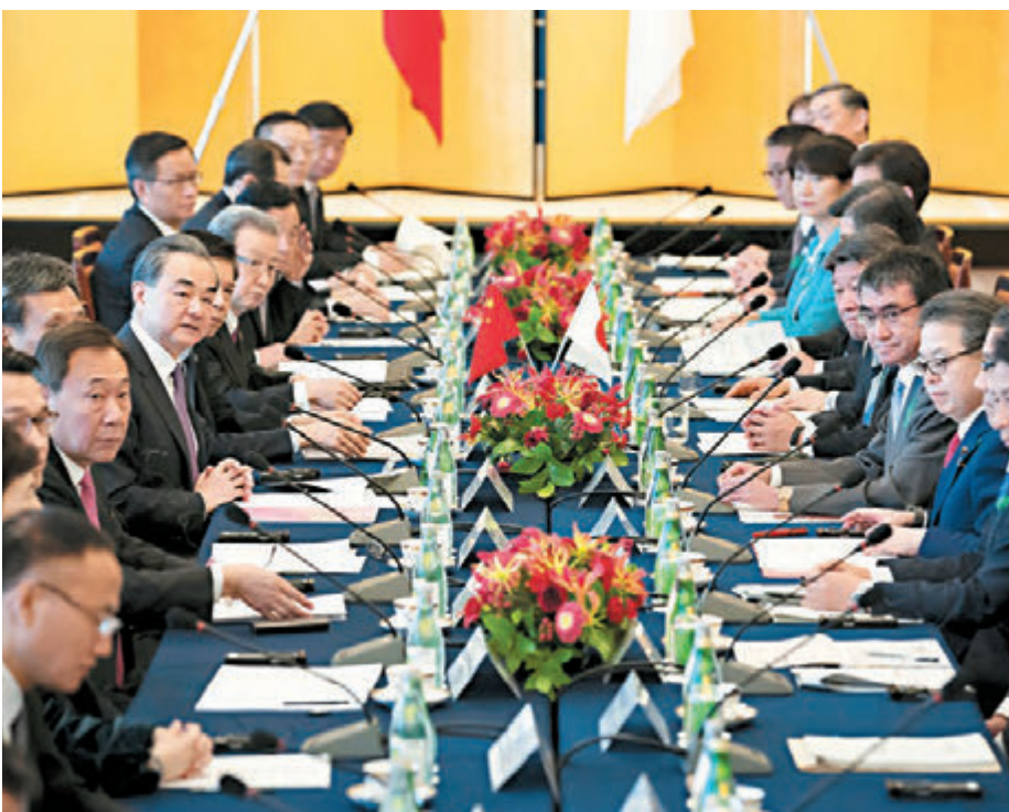
中國國務委員兼外交部長王毅在日本東京同日本外相河野太郎共同主持中日第四次經濟高層對話。

河野太郎表示，日中經濟合作是兩國關係的重要基礎和推動力。在日中和平友好條約締結40周年之際，日中關係面臨全面改善、穩定發展的機遇。面對兩國和世界經濟形勢的新變化，日方願同中方以新的視角規劃拓展兩國經貿合作。日方高度重視習近平主席在博鰲亞洲