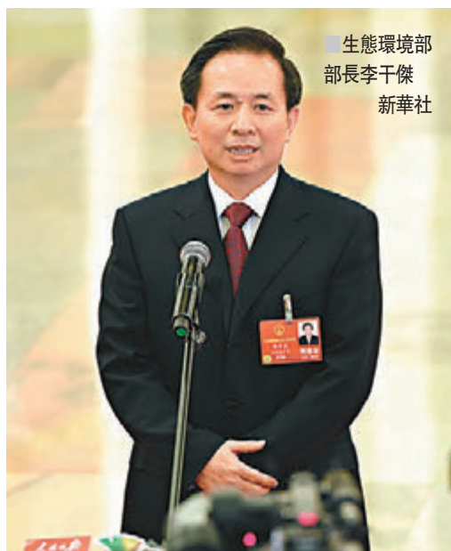
生態環境部部長李干傑

香港文匯報訊 (記者 張聰 兩會報道) 十三屆全國人大一次會議第七次全體會上，李干傑當選為首任生態環境部部長。會議結束後，李干傑在「部長通道」接受採訪時表示，生態環境部整合了環保部原有全部職責和其他6個部門的相關職責，未來工作範圍更寬，事情更多，挑戰也更大了，要履好職盡好責確實壓力很大。同時，他指出，生態環境部正加快研究出台「藍天保衛戰三年作戰計劃」，通過穩步推動農村居民的散煤燃燒的煤改氣等舉措，爭取更快地改善生態環境質量，讓人民群眾「藍天幸福感」明顯增強。