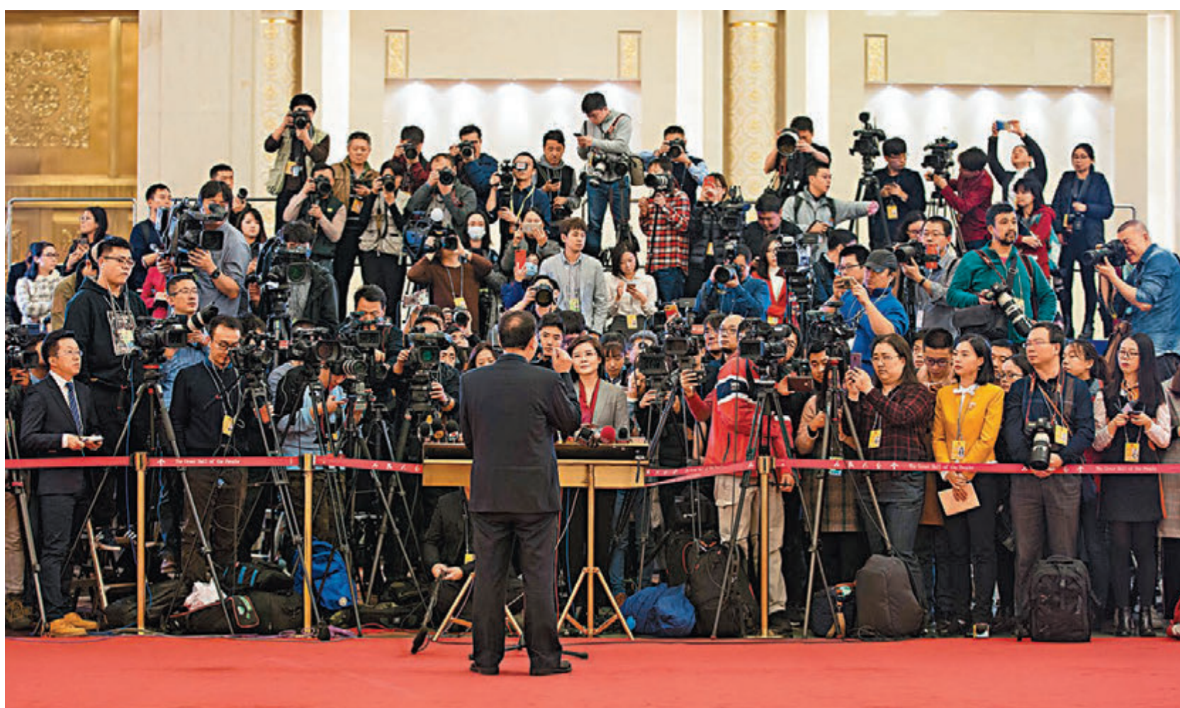
生態環境部正加快研究出台「藍天保衛戰三年作戰計劃」，讓人民群眾「藍天幸福感」明顯增強。圖為19日記者在「部長通道」採訪。

李干傑指出，煤改氣、煤改電並非指所有煤，而是農村居民家裡的煤，「1噸散煤相當於15噸以上電煤的排放量，京津冀周邊28個城市，大致有五六千萬噸。所以在污染物排放量總量佔相當比重，把這塊治理好，不僅僅會帶來很好的環境效益，同時也帶來很好的社會效益。」