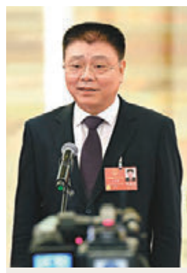
住房和城鄉建設部部長王蒙徽

對於公租房建設，王蒙徽進一步表示，繼續加快推進棚戶區改造以及大力推進公租房建設，特別是在公租房建設中，要把外來務工人員、城市無房戶等群體納入公租房保障體系。此外，住建部還將建立和完善差異化調控政策體系，以及房地產等統計和市場監測預警機制，更好地提高調控精準性。