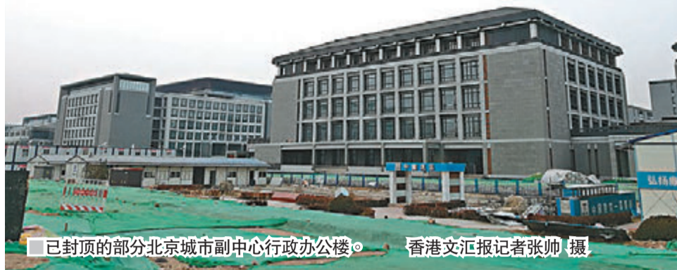
已封顶的部分北京城市副中心行政办公楼。

据了解,北京城市副中心总用地面积约155平方公里,其中行政办公区占地约6平方公里,预计建设规模3.8平方公里。根据中共