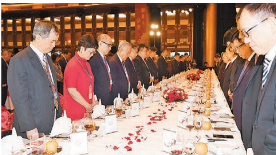
■ 蔡英文21日出席2018大陆台商春节联谊活动。图为出席官员和与会台商在活动开始时一起为花莲地震罹难者默哀。

薛清德指,生产型产业最需要用电,但蔡英文倡导的是非核家园,禁止核能发电。“靠爱发电能供应足够吗?”此外,高科技化的