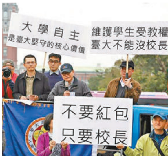
■ 近200名台大师生上台北凯道游行,抗议当局迟迟未落实管中闵正式担任校长。

香港文汇报讯 据中通社报道,因不满准校长管中闵无法准时上任,近200名台大大学生、教授及校友21日上台北凯道格蓝大道(简称“凯道”)向蔡英文“拜年”,呼吁尊重大学自主,组织游行的联盟还准备“傅钟”(台大校钟,是该校象征之一)看板,送给蔡英文。