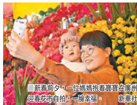
新春前夕，一位媽媽抱着寶寶在廣州迎春花市自拍，一臉幸福。