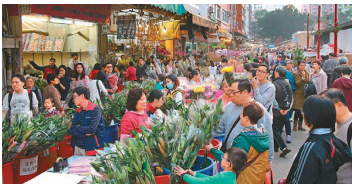
有花商料市民會因農曆新年的關係而少買情人節花束，不會出現節日的「協同效應」。