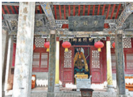
■紀念邵雍的邵夫子祠。