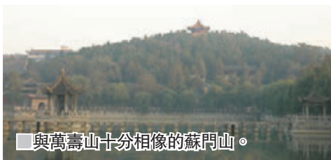
■與萬壽山十分相像的蘇門山。