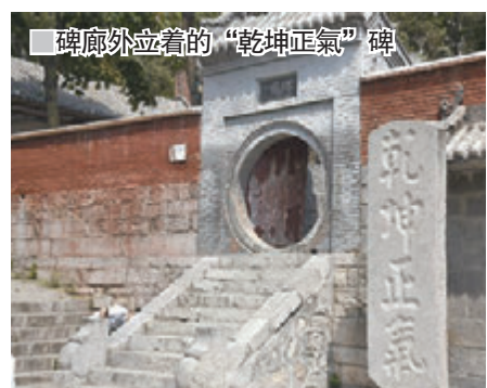
■碑廊外立着的“乾坤正氣”碑