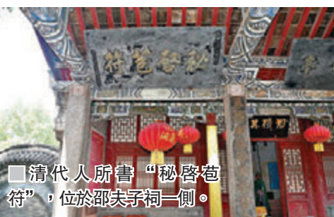
■清代人所書“秘啓苞符”，位於邵夫子祠一側。

從西門進入景區，圍繞湖水漫步，第一處古蹟便是邵夫子祠。邵夫子祠是明代輝縣知縣張錦為紀念邵雍所建，清道光年間增建。宣統二年（1910年）袁世凱、徐世昌於北側添建廂房四間，祠內植有桃、竹，為邵雍親手所植，故又名“桃竹園”。走進祠堂大門，滿院綠蔭。直走便是正殿、拜殿，南北兩邊各列廂房。正殿塑邵雍坐像，拜殿正中懸“擊壤亭”匾，兩側有朱熹撰、徐世昌書“駕風鞭霆”及愛新覺羅·成孚書“秘啓苞符”二匾，正殿偏側有碑刻數塊。