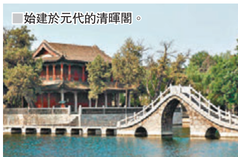
■始建於元代的清暉閣。