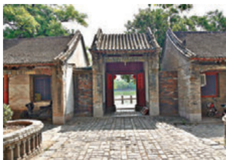
■邵夫子祠的古老院落。

除了百泉湖，景區內最著名的就是蘇門山，以及沿湖一周的古蹟邵夫子祠、碑廊、衛源廟、孫登嘯台，還有湖東岸邵雍所建的太極書院。在蘇門山與百泉湖加起來70.5萬平方米的整個景區內，有出現於不同朝代的93處名勝200餘間古建築，無法一一列舉。