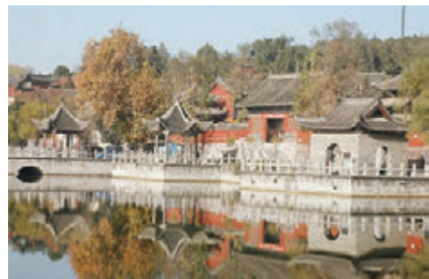
■百泉湖景區神似頤和園。