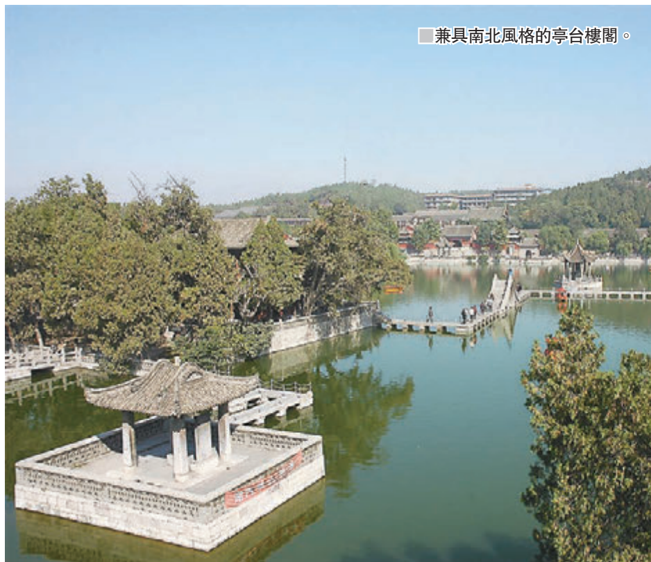
■兼具南北風格的亭台樓閣。

百泉湖景區在河南新鄉輝縣西北，如果不是身臨其境，很難想像南方風格的亭台樓閣、碧水假山能夠出現在中國的北方。百泉湖起源於商代，成熟於唐宋，完備於明清，景區風格兼具了南方的玲瓏雅致和北方的雄渾厚重。這種風格融合在北方園林中是很罕見的。