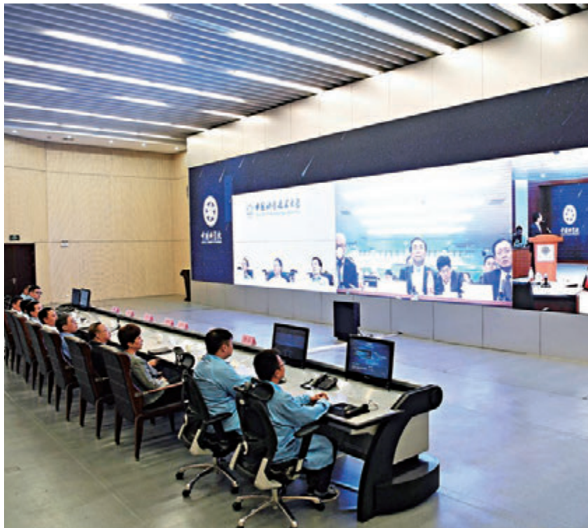
■中奧兩國科學家實現世界首次洲際量子保密通信視頻通話。 資料圖片

論文審稿人稱讚，洲際量子保密通信網絡實驗是「重大技術成果」，「任何不用衛星的方法（如在發展的量子中繼器）可能至少需要10年的時間才能接近這個實驗的結果。」