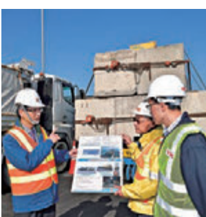
■香港路政署署長鍾錦華（左一）早前見證香港接線高架橋段最後一座橋樑上的負重荷載測試。

各航空公司開放機上使用手機時間表如下：1月17日：海南航空；1月18日：東方航空、祥龍航空；1月19日：南方航空、廈門航空、四川航空、上海航空、首都航空；1月21日：中國國際航空、春秋航空；1月22日：山東航空、長龍航空；1月23日：深圳航空。