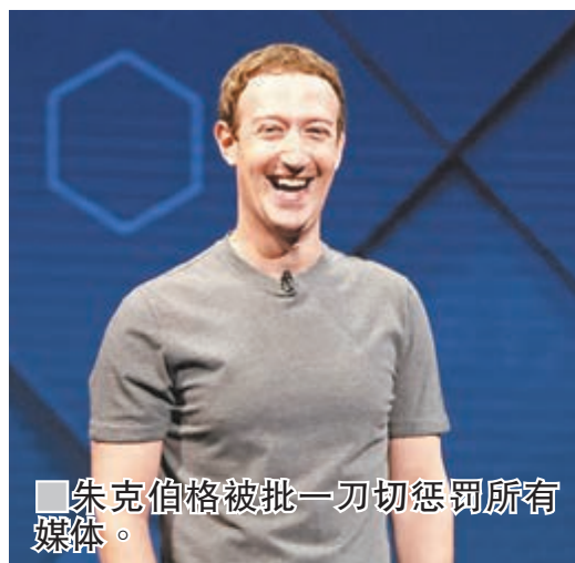
朱克伯格被批一刀切惩罚所有媒体。

业界人士直言fb根本是怕再惹上政治争议，所以索性“斩脚避沙虫”。代表《纽约时报》等媒体的美国出版业团体“未来数字内容公司”(DCN)行政总裁金特认为，fb应该透过其他方法打击假新闻，而非一刀切惩罚所有媒体。 ■综合外电