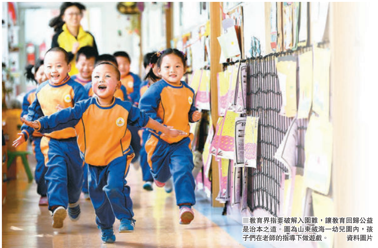
教育界指要破解入園難，讓教育回歸公益是治本之道。圖為山東威海一幼兒園內，孩子們在老師的指導下做遊戲。 資料圖片