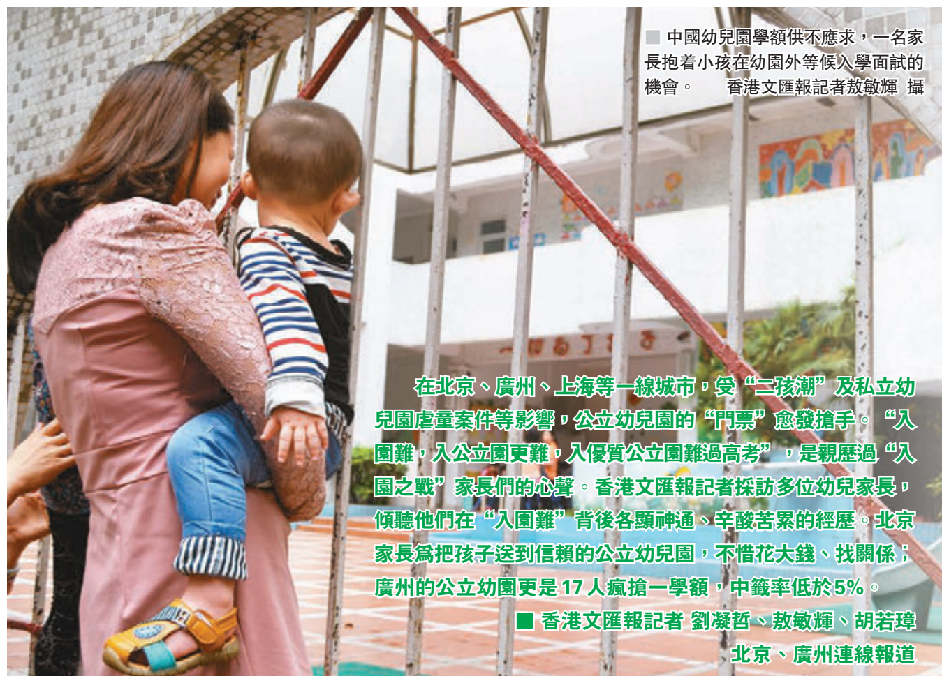
中國幼兒園學額供不應求，一名家長抱着小孩在幼兒園外等候入學面試的機會。

在北京、廣州、上海等一線城市，受“二孩潮”及私立幼兒園虐童案件等影響，公立幼兒園的“門票”愈發搶手。“入園難，入公立園更難，入優質公立園難過高考”，是親歷過“入園之戰”家長們的心聲。香港文匯報記者採訪多位幼兒家長，傾聽他們在“入園難”背後各顯神通、辛酸苦累的經歷。北京家長為把孩子送到信賴的公立幼兒園，不惜花大錢、找關係；廣州的公立幼兒園更是17人瘋搶一學額，中籤率低於5%。