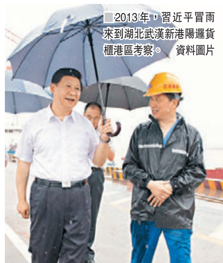
2013年，習近平冒雨來到湖北武漢新港陽邏貨櫃區考察。資料圖片

深入學習貫徹黨的十九大精神和習近平新時代中國特色社會主義思想，深刻領會指示的內容和精神實質，牢固樹立「四個意識」，不斷提高政治站位和政治自覺，以永遠在路上的堅韌鏗而不撓抓好作風建設；各地區各部門年底召開民主生活會和組織生活會，要把貫徹落實中央八項規定精神、轉作風改作風情況作為對照檢查的重要內容，切實按照習近平總書記的重要指示要求，認真查找「四風」突出問題特別是形式主義、官僚主義的新表現，採取過硬措施，堅決加以整改，務求取得實效；要堅持從各級領導幹部做起，以上率下、層層帶動，繼續緊盯元旦、春節等時間節點，從一件件小事抓起，堅決防止不良風氣反彈回潮，不斷鞏固和拓展落實中央八項規定精神的成果。