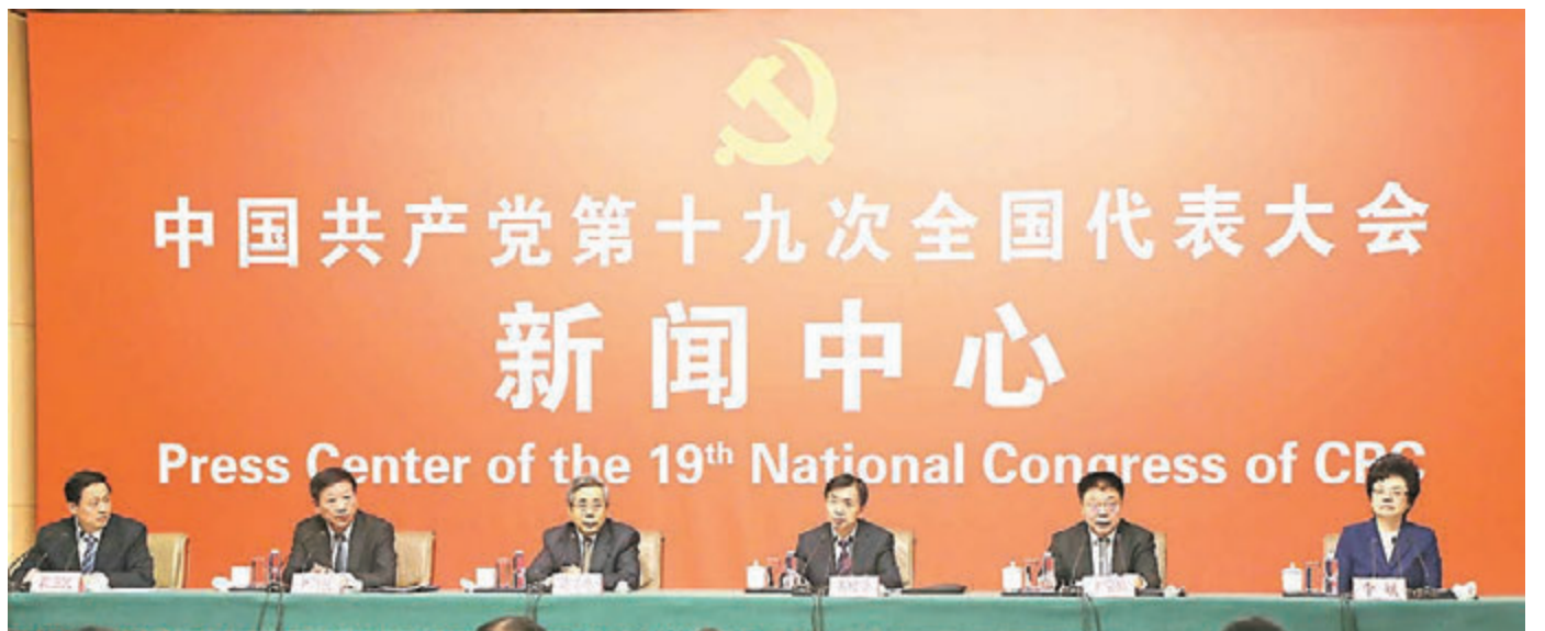
■十九大新闻中心22日邀请教育部、民政部、人力资源社会保障部、住建部、国家卫生计生委相关负责人介绍满足人民新期待，保障改善民生有关情况。

陈宝生还展望，2049年，中国教育将稳稳地站在世界中心，引领世界教育发展，到那个时候，中国的标准将成为世界的标准。他展望，届时中国将成为世界上人们最向往的留学目的地，将有各国愿意和中华文化实现交流融合、学习交流中国发展经验的有知识的学生、老师来中国交流，并在交流中实现共同进步。世界教育发展的规则，中国将有更大的发言权，并为世界教育提供中国方案、中国智慧，中国的教材、包括汉语拼音的教材也将走向世界。