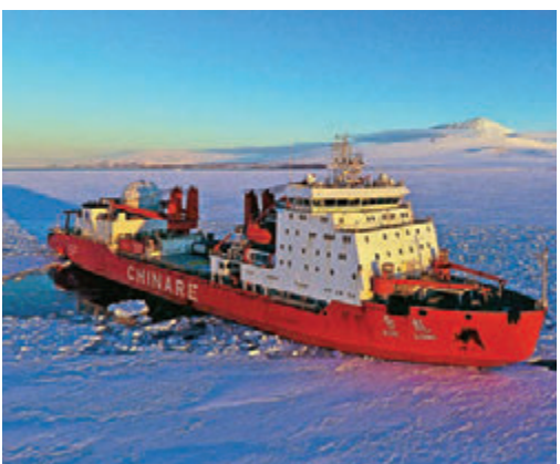
■“雪龙号”是中国唯一能在极地破冰前行的船只，已先后31次赴南极。

香港文汇报综合新华社、《科技日报》及澎湃新闻报道：中国科考船的设计建造已跟从走到了世界引领的黄金期，新建、在建数量均居世界首位。据悉，截至今年8月，中国正在设计或建造的海洋科考船约10艘。中国船舶工业集团公司七〇八研究所总工程师黄蔚说，不只是数量的提升，中国新建的科考船在性能等方面也进入第一梯队，逐步努力引领发展，正在从改装到专业新建，从近海到深海、远洋、极地的进程中逐步迈进。