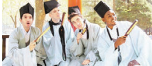
■在北京的海外留学生拍汉服毕业照。