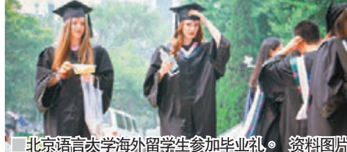
■北京语言大学海外留学生参加毕业典礼。