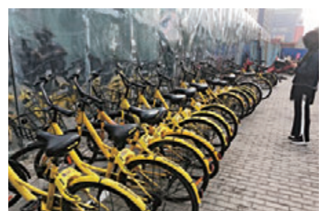
▲北京街头共享单车随处可见

而漫步北京街头，第一印象就是街边停满了五颜六色的共享单车。路人手机一扫码解锁，骑上就走，非常方便。好奇心之下，记者用手机注册开通了帐户，从新闻中心门外骑上一辆单车骑行回到住处。