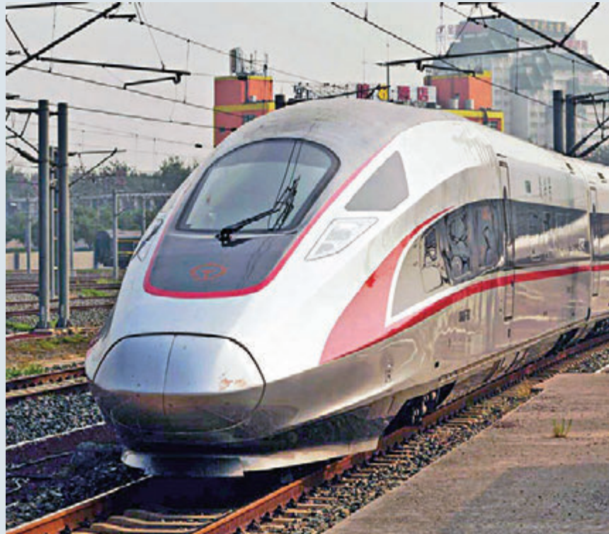
▲中国“新四大发明”：高铁、共享单车、网购和移动支付，为衣食住行带来便利