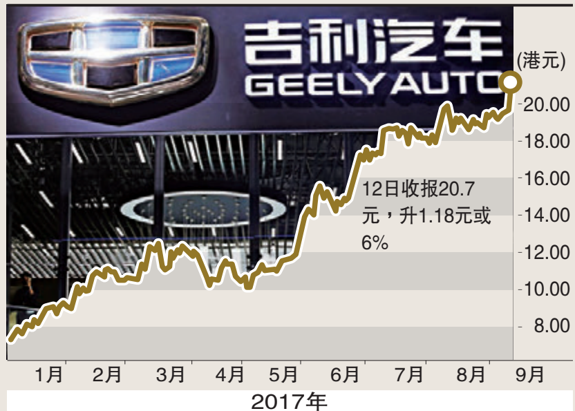
吉利汽车股价破顶

近年吉利汽车母公司吉利控股不断东征西讨，继早前收购宝腾汽车及豪华跑车品牌莲花的股份后，下一个目标可能是印度。据印度传媒引述消息报道，吉利控股正与印度JSW集团商讨成立合资公司，投资额约10亿美元，各占一半权益，将针对高价电动车市场，并涉足电池及承包兴建充电站等基建工作。同时，大摩指8月中国电动车销售持续强劲增长，令一众新能源车概念股齐齐炒上。