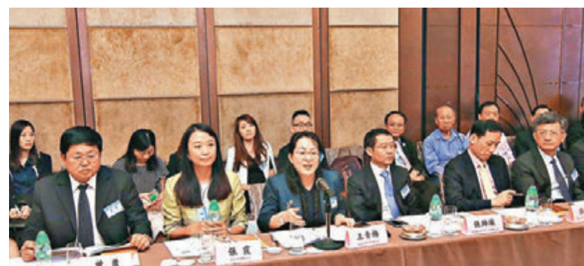
「2017滇港金融產業合作說明會」上，多位講者都希望兩地可以作更多商業對接。

另外，「2017滇港旅遊合作香港說明會」也於同日舉行，在會上，雲南省旅遊發展委員會領導和有關旅遊項目負責人對相關項目作了推介。