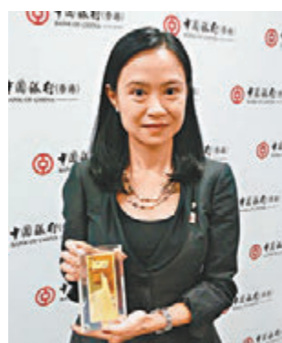
張穎思稱，目前紙黃金佔中銀黃金交易量約85%，另15%為黃金交投。

香港文匯報訊 (記者 周紹基)服務香港100年的中國銀行，為紀念其百周年年慶，中銀香港推出三款限量版紀念金條，最重達1公斤，其他兩款紀念金條分別為10克及100克，早於今年4月已推出。至於公斤條則計劃於10月初推售，限量更只有100枚，高增值客戶可優先認購。10克、100克及1000克的紀念金條，以市價計現時售價分別約3,600元(港元，下同)、3.6萬元及36萬元。