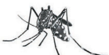
白纹伊蚊会传播登革热。网上图片