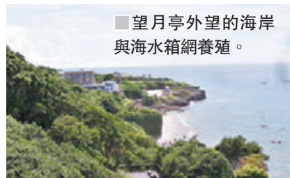
望月亭外望的海岸與海水箱網養殖。

時露出水面的一塊區域。獨特的珊瑚礁地形造就了豐富的動植物生態，退潮時所遺留的生物：如海膽、海星、海兔、海葵、寄居蟹、海參、螺貝類、各種各式熱帶魚及藻類等。