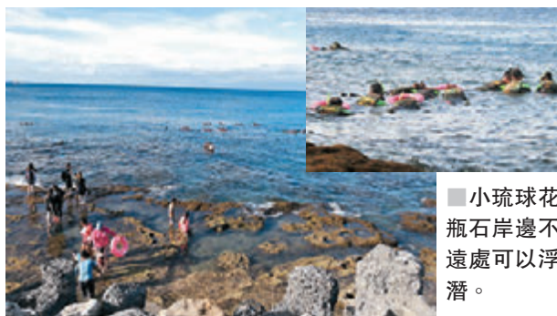
小琉球花瓶石岸邊不遠處可以浮潛。

在花瓶石周圍，正在海水面下新形成的珊瑚群礁，許多遊客除了在此打卡，也會戲水及玩浮潛，看見教練帶領一隊隊遊客穿戴蛙鏡、拎着救生圈向海岸出發，玩浮潛看海龜、珊瑚魚、海葵等，十分開心！