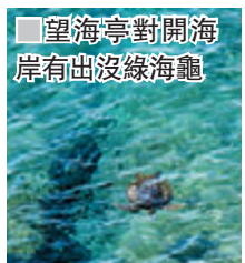
望海亭對開海岸有出沒綠海龜

時露出水面的一塊區域。獨特的珊瑚礁地形造就了豐富的動植物生態，退潮時所遺留的生物：如海膽、海星、海兔、海葵、寄居蟹、海參、螺貝類、各種各式熱帶魚及藻類等。