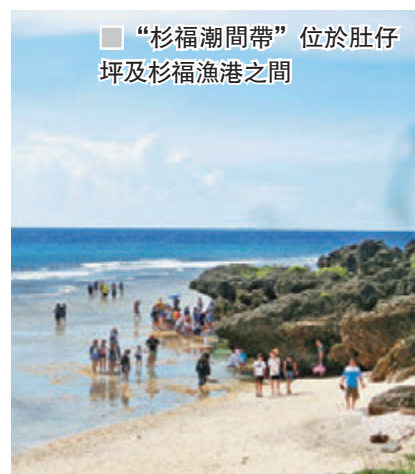
“杉福潮間帶”位於肚仔坪及杉福漁港之間