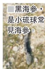
黑海參，是小琉球常見海參。