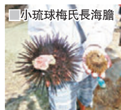
小琉球梅氏長海膽