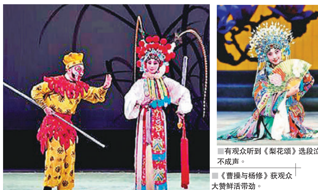
■ 有观众听到《梨花颂》选段泣不成声。

“艺术家原地踏步，容易‘弹尽粮绝’，只有接地气，扎根生活，才能不断出好戏。”在谷好好看来，此次上海戏曲院团共同深入基层慰问，有利于整体人才培养、剧目建设，工业建设成就、百年易俗社、辽阔草原都让艺术家们找到新的灵感。