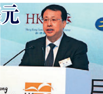
▲山东省副省长、省长龚正

约，总投资额280亿美元，其中外资金额124.6亿美元。项目涉及现代金融、新能源、信息、旅游等多个领域。 深化科技人才合作和金融资本合作是未来鲁港合作的重点。龚正表示，山东正深入推进国企改革，支持非公有制经济健康发展。欢迎香港企业以股权、债权等灵活多样方式，参与该省国有企业改革，支持山东企业改制上市、发行债券，实现互利共赢发展。