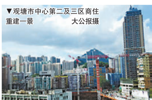
▼观塘市中心第二及三区商住重建一景

【大公报】记者林志光报道：香港发展商去年展开大量地基工程，令今年私人住宅的上盖工程动工量大幅上升，上半年已接近1.26万伙，是自2004年以来，半年计的新高纪录。