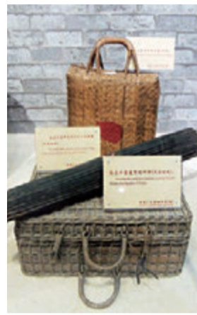
▲陪伴水客走南闯北的箱子、雨伞等