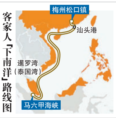
客家人「下南洋」路线图