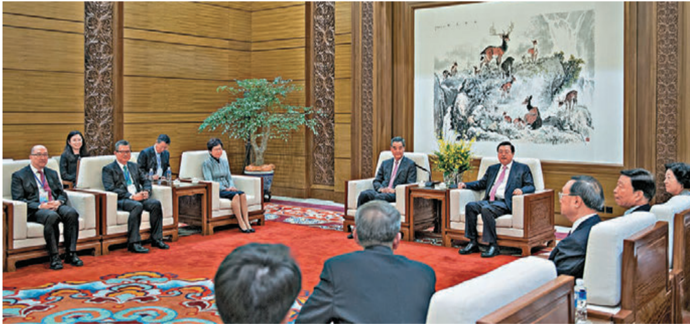
◀张德江会见全国政协副主席、香港特别行政区行政长官梁振英，候任行政长官林郑月娥等。

展览由香港特别行政区政府主办，共分“一国两制”、“香港近况一览”、“一起把握机遇”等10个展区，通过图片、文字、实物以及多媒体互动影音技术等形式，全面反映了香港回归祖国20年来所取得的巨大成就。展览重点是香港和祖国“同心”在“一起”，共同推进香港的繁荣稳定和国家的对外开放和现代化建设，为实现中华民族伟大复兴一起创造更美好的明天。展览于6月27日至7月16日，在国家博物馆南一展厅对观众开放。