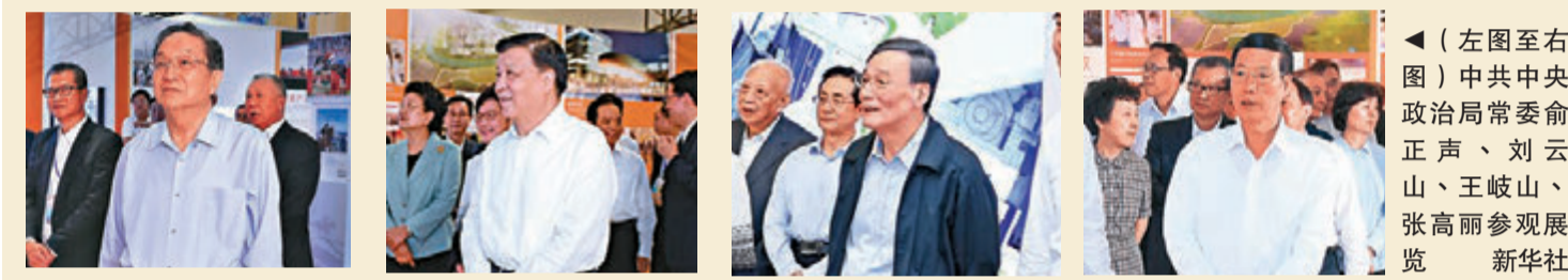
◀（左图至右图）中共中央政治局常委俞正声、刘云山、王岐山、张高丽参观展览。