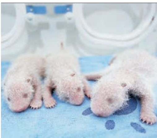
「陽陽」和「愛濱」產下的三隻熊貓幼崽。