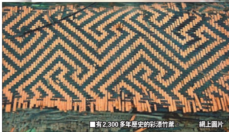
■有2,300多年歷史的彩漆竹蓆。