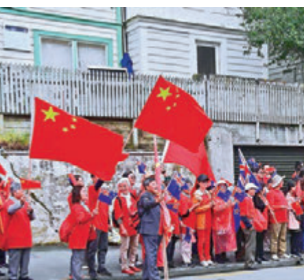
▲27日，惠灵顿华人华侨夹道欢迎李克强。

【大公报讯】据环球网报道：新西兰移民局27日发布消息，以旅游、探亲或进行商务活动为目的前往新西兰，并于2017年5月8日后递交签证申请的中国公民，可获最长5年多次往返签证。同时，新西兰总理当天在记者会上表示，“中国是新西兰第二大游客市场，旅游业是促进两国经济增长和文化认识的动力。”中纽总理确认，将2019年定为中新—新西兰旅游年。