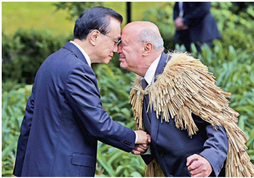
▲27日上午，新西兰总理英格利希为中国国务院总理李克强举行隆重欢迎仪式。图为李克强与毛利文化顾问同行“碰鼻礼”。

【大公报讯】中国国务院总理李克强当地时间27日上午在惠灵顿总理府同新西兰总理英格利希举行会谈。李克强表示，中纽发展战略契合度高，互补优势明显。中方愿同纽方深挖合作潜力，构建“1+3”升级版合作新格局：打造一个“升级版”自贸区，提升经贸合作水平。同时，以发展战略对接、创新驱动、农牧业合作为三大增长动能，为中纽合作提供多元支撑。当天，新西兰与中国签署“一带一路”合作协议，成为首个签署相关协议的西方发达国家。