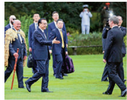
▲李克强与英格利希在欢迎仪式上会面。

纽合作提供多元支撑。加强“一带一路”合作，为两国企业提供新机遇。加强联合研究和信息共享，引导新业态和新商业模式合作，拓展跨境电子商务合作。在应对气候变化领域加强合作。扩大高技术、高附加值的农牧业全产业链合作。