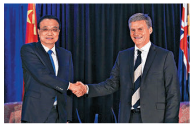
▲李克强同新西兰总理英格利希会见双方合作文件签署。

据新西兰旅游局统计，2016年中国赴新西兰旅游人数突破40万，新西兰移民部长迈克尔·伍德豪斯称，新措施将使中国游客来访新西兰更方便。