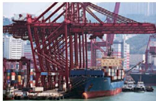
▲環球經濟環境有所改善，倘若持續，可為亞洲貿易帶來支持，香港出口也能受惠

按地區分析，今年2月份比去年同期，出口到亞洲整體貨值上升29.9%。尤其是中國台灣