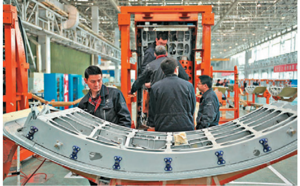
▲國家統計局指出，總體看工業企業利潤仍屬於恢復性增長