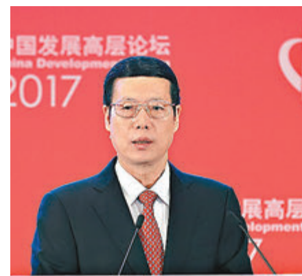
中共中央政治局常委、國務院副總理張高麗出席開幕式並致辭。

本屆中國發展高層論壇由國務院發展研究中心主辦，主題是「中國與世界：經濟轉型和結構改革」。來自國內外的專家學者、企業家、政府官員和國際機構代表參加了開幕式。