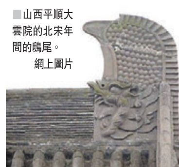
山西平順大雲院的北宋年間的鸞尾。網上圖片