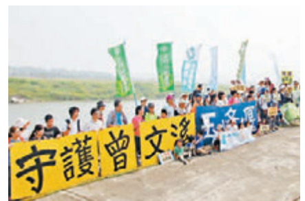
環保團體19日同步在台北、台中、台南以及高雄等城展開守護水資源行動。

香港文匯報訊 據新華社報道，在3月22日「世界水資源日」到來之際，台灣環保團體19日在北、中、南部同步舉辦守護水資源行動，呼籲保護水源區，不應因工程建設對水庫造成破壞。