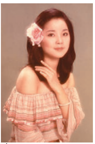
鄧麗君生前紅遍日本、美國、東南亞以及中國。資料圖片

早春的第一縷陽光灑向樹梢時，地處河北省邯鄲市大名縣的鄧台村已是炊煙裊裊。村旁矗立的鄧麗君塑像前，一捧花束靜靜地擺放在那裡。不遠處的麗君廣場上，幾名孩童圍着水池追逐嬉戲。青磚灰瓦間，現代元素混搭着明清遺風，牆壁上隨處可見「跳動」的音符。鄧台村，這個只有600人口的小村莊是鄧麗君的祖籍地。 ■中新社