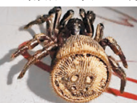
金錢活門蛛因尾部圓紋似銅錢而得名。

雲南昭通鹽津廟壩村民上週四（16日）在玉米地裡發現了一隻類似蜘蛛的生物，外形奇特，屁股圓圓的，上面還有花紋。經查詢，這是一種學名為里氏盤腹蛛的罕見蜘蛛，在中國一共只發現過六隻。