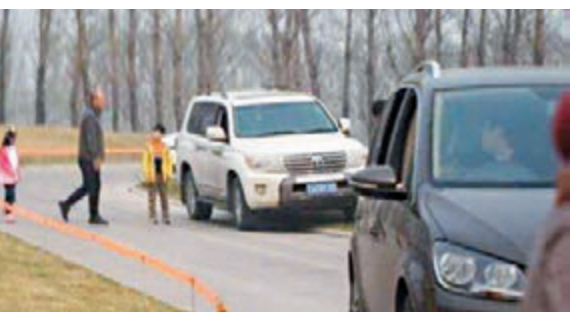
北京野生動物園工作人員稱，網傳自駕遊下車圖片確是該園白虎園區。

有網友19日發圖稱，在北京野生動物園自駕區，有人不聽勸阻下車。北京野生動物園工作人員稱，網傳自駕遊下車圖片確係該園白虎園區。北京公安局發微博提示：老虎不是吃素的！