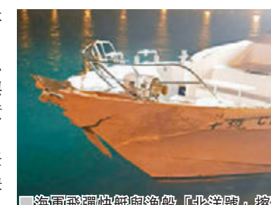
海軍飛彈快艇與漁船「北洋號」擦碰，「北洋號」船頭嚴重受損。

台海軍司令部也指出，飛彈快艇這次任務是實施海上夜間對抗操演，磨練飛彈快艇夜間作戰能力，以因應未來作戰需求，不會因這次事件影響任何夜間作戰訓練。