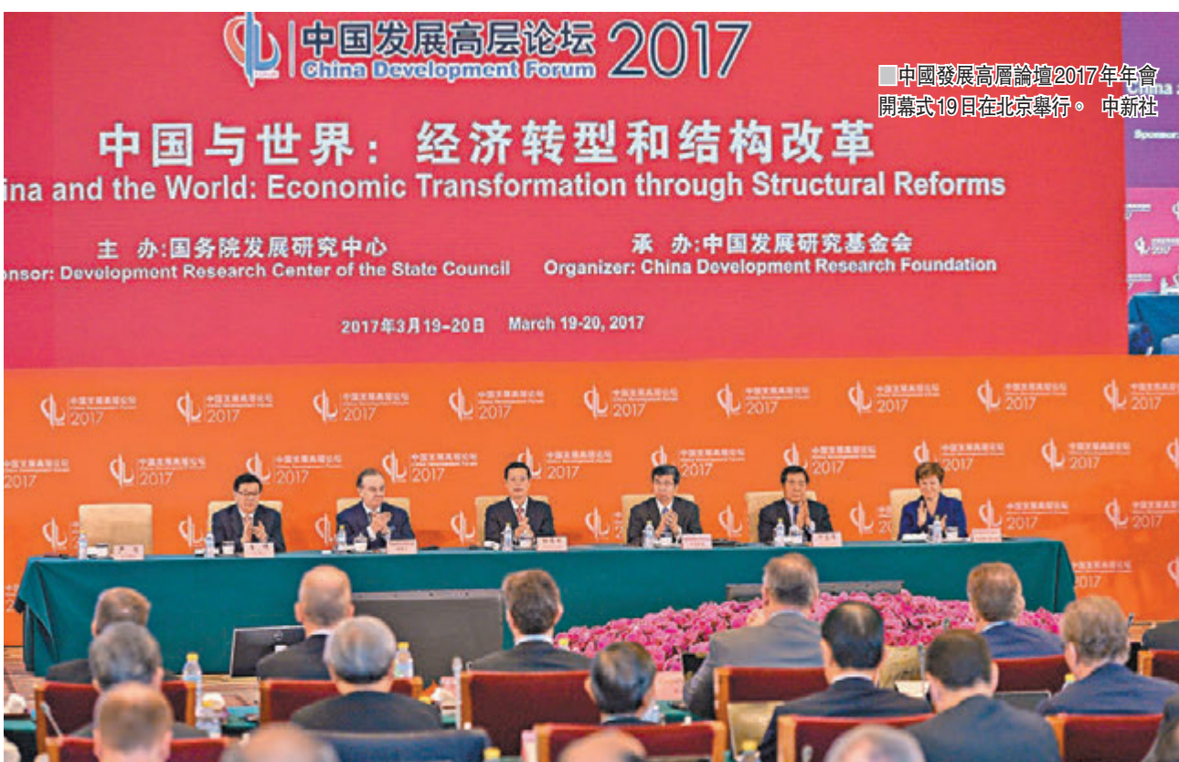
中國發展高層論壇2017年年會開幕式19日在北京舉行。

香港文匯報訊（記者 海巖 北京報道）在19日的中國發展高層論壇上，多位宏觀部門主官針對金融、房地產泡沫風險密集發聲，預示宏觀調控下一步新走向。中國國家發改委主任何立峰表示，當前中國經濟發展面臨三大結構性失衡，並特別指出大量資金在金融體系內自我循環，還有大量資金湧入房地產市場，導致實體經濟融資困難並推高成本。工信部部長苗圩則指出，社會資本「避實趨虛」的問題必須改變，「錢生錢」將會產生泡沫和危機。何立峰表示，今年將把防控金融風險放在更加重要的位置，控制信貸資金過度流向房地產業。