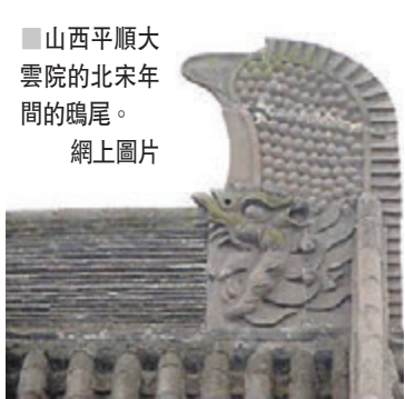
山西平順大雲院的北宋年間的鸞尾。網上圖片