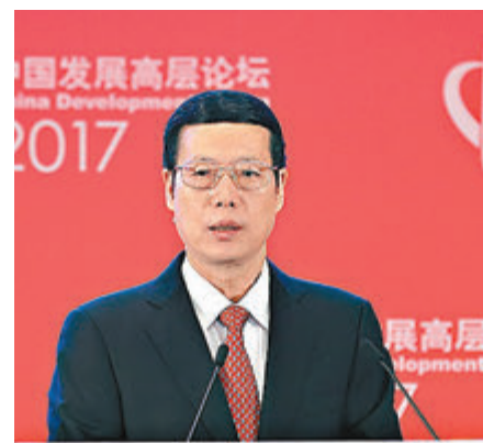
中共中央政治局常委、國務院副總理張高麗出席開幕式並致辭。

格局的新變化，推動形成更加公平合理的全球治理體系。 張高麗說，今年將召開黨的十九屆全國代表大會，也是中國實施「十三五」規劃的重要一年，是推進供給側結構性改革的深化之年。我們將深入貫徹習近平總書記系列重要講話精神和治國理政新理念新思想新戰略，按照中央經濟工作會議和政府工作報告要求，全面做好穩增長、促改革、調結構、惠民生、防風險各項工作，保持經濟平穩健康發展和社會和諧穩定。 本屆中國發展高層論壇由國務院發展研究中心主辦，主題是「中國與世界：經濟轉型和結構改革」。來自國內外的專家學者、企業家、政府官員和國際機構代表參加了開幕式。