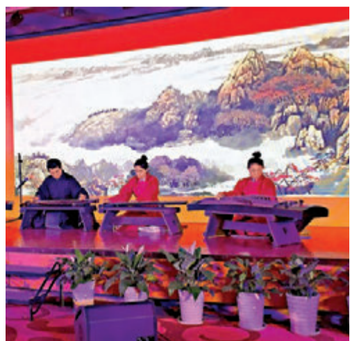
▲启动仪式现场中国音乐学院雅乐团演出古典雅乐《琴瑟和鸣》

工程包括创立“汉文化产业基地”，推动汉文化与产业结合；筹设“汉文化推广基金”，为产业实现和可持续发展营造孵化空间；组建“汉文化学院”，为汉文化的继承、繁荣、推广培养专业人才和师资力量。陕西汉中市“汉文化博览园”将成为“世界汉字大会、汉学大会、汉文化大会”永久会址。