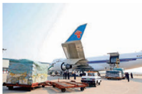
▲白云机场将大力推进航空货运