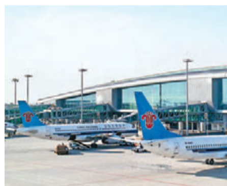
▲白云机场去年客运量超过新加坡，进一步逼近香港机场