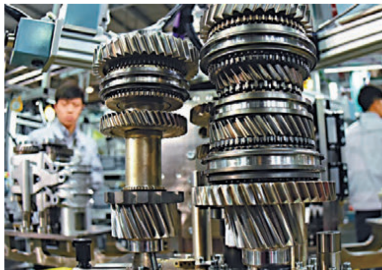
▲武汉正全力打造支撑长江经济带发展的国家先进制造业中心。工人于东风格特拉克变速箱公司生产线工作

对于征收房产税他持谨慎态度，认为在购买房屋过程中，购房者已交过一大笔土地出让金，再征税是否合理尚需讨论。而且上海、重庆的房产税试点并没有能够抑制房价上涨，真正要解决高房价问题还是要靠提高供给。他又指，（银、证、保）三会合一进行混业监管或是大势所趋，寻求新综合监管模式属客观必然。