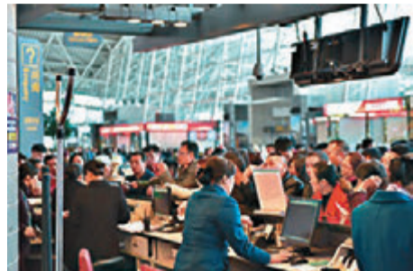
▲广州白云机场总体客流量持续增长 网络图片