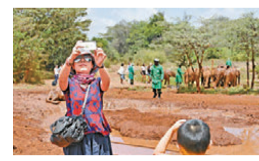
▲一名中国游客在肯尼亚首都内罗毕的象园自拍留念 资料图片

报告认为，中国出境游客文明形象得分仍然不高，需要在加强法律约束、推动齐抓共管、创新制约机制等方面进一步寻求解决之道。