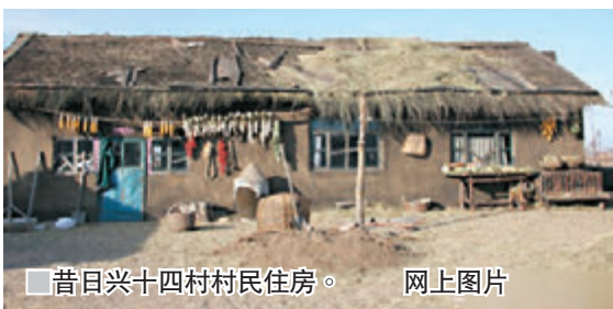
昔日兴十四村村民住房。

沿柏油村路前行，兴十四村街道两旁现代化的学校、宾馆、体育馆、多层住宅及全国第一家用粟米