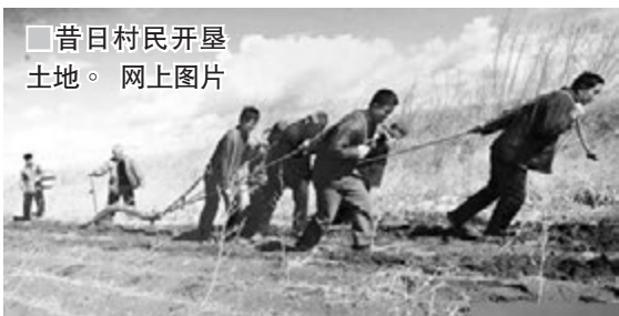
昔日村民开垦土地。网上图片