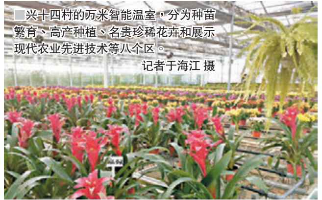
兴十四村的万米智能温室，分为种苗繁育、高产种植、名贵珍稀花卉和展示现代农业先进技术等八个区。