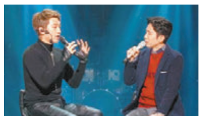
■ 由Rain作詞的《最好的禮物》，日前已被節目主持質疑是求婚歌。網上圖片