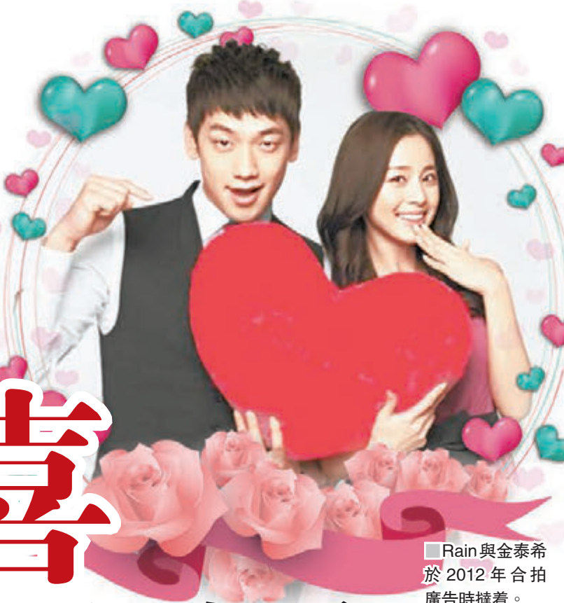
■ Rain與金泰希於2012年合拍廣告時碰着。