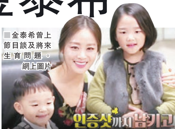
■ 金泰希曾上節目談及將來生育問題。