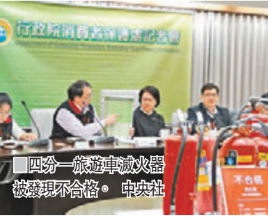
「四份一旅遊車滅火器被發現不合格。」