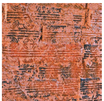
湖南省郴州市桂東縣發現的磚式古墓，墓磚紋式精美。

17日從湖南省郴州市桂東縣獲悉，近日，桂東縣文物事業管理所工作人員在桂東縣城區一項目施工現場，發現三座磚式古墓葬，其中兩座初步鑒定為東漢末年到西晉時期墓葬。