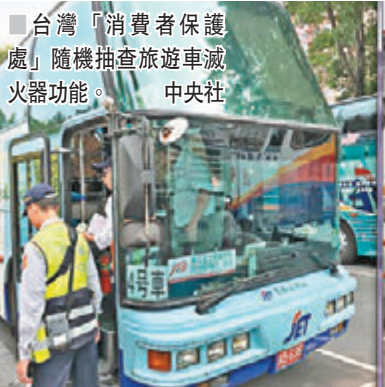
台灣「消費者保護處」隨機抽查旅遊車滅火器功能。

香港文匯報訊 據中新社報道，年關將至，台灣「消費者保護處」隨機抽查旅遊車滅火器功能最新結果顯示，45件中有5件型式不合格、6件噴射檢驗不合格，比例超過24%。