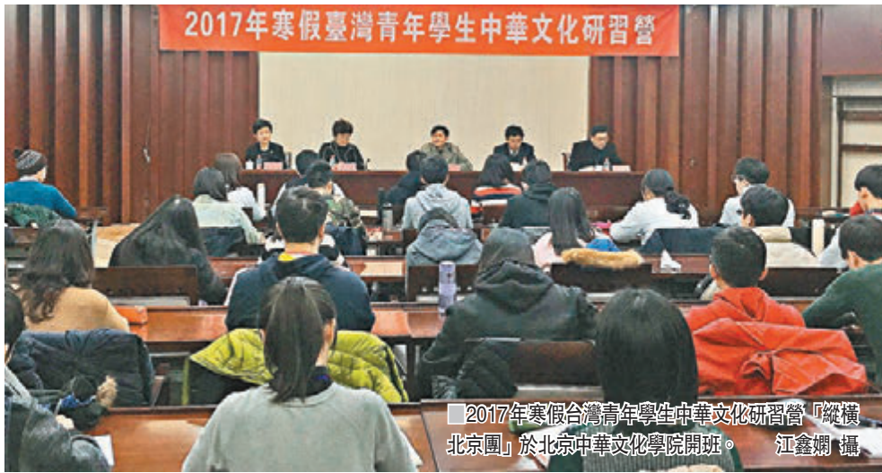
2017年寒假台灣青年學生中華文化研習營「縱橫北京團」於北京中華文化學院開班。江鑫嫻攝。

該研習營於1月13日至24日舉行，8個團隊約370人，涵蓋全台幾十所大學，大多數同學是首次赴陸。是次研習營為台灣青年們安排了「一帶一路」戰略、中華傳統文化賞析、北京民俗文化等系列講座。同時，他們還將分組參觀北京城市規劃館、國家博物館、抗日戰爭紀念館、頤和園、故宮、長城等地。此外，同學們還有機會體驗古法造紙和活字印刷、體驗北京冬季特色的滑雪等，並與大陸的青年學生互相交流。