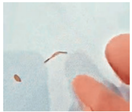
■早前有食客懷疑在酒樓誤食“橡筋米”，食環署已證實是大米。

食安中心並把該五個樣本進行塑化劑、黃麴毒素、金屬雜質等化學檢測，結果顯示全部樣本合格。