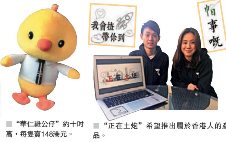
“正在土炮”希望推出屬於香港人的產品。

香港食物環境衛生署轄下全港15個年宵市場，在將到的星期日起一連七日“開鑼”，其中全港最大型的維園年宵市場，除了售賣傳統的年花和年貨外，每年都吸引充滿創意和活力的年輕人集資競投攤位，售賣自創特色賀年貨品。