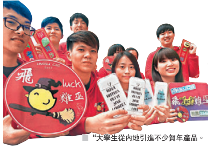
“華仁雞公仔”約十吋高，每隻賣148港元。

香港文匯報訊 據大公報報道，維園年宵將於星期日(22日)開鑼，來年是雞年，“雞抱枕”、“雞公仔”、“雞風車”、“雞揮春”遍佈全場，華仁仔攤檔更推出“雞版華仁仔”。不過，年輕人創意怎可能止於“雞”，一句觸動人心的歌詞、潮語，又或文藝短語，都成為設計泉源。年宵已成為一班年輕創業先鋒的練兵場。