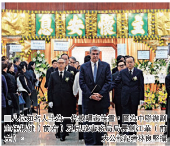
■八位知名人士為一代歌唱家費明儀扶靈。圖為中聯辦副主任楊健(前右)及民政事務局長劉江華(前左)。

香港文匯報訊 據大公報報道，香港樂聲界殿堂級人物費明儀於本月三日離世，16日在紅磡世界殯儀館設靈，17日晨出殯，各界名人好友紛來向一代歌唱家作最後道別。大殯儀式於17日早上10時開始，由中聯辦副主任楊健、香港民政事務局長劉江華等人扶靈，11時許費明儀的靈柩由靈車運往柴灣歌連臣角火葬場。