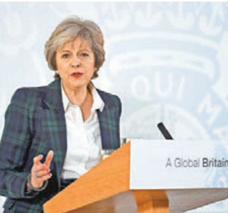
■英國首相文翠珊17日宣佈「脫歐」方案，強調英國將徹底離開歐盟「單一」市場。

香港文匯報訊 綜合報道，英國將在3月底前啟動脫歐程序，英國首相文翠珊17日在倫敦蘭卡斯特宮公佈脫歐計劃，她列出12點方案，涵蓋邊境控制、司法管轄權及自由貿易協議等範疇，當中重新取得英國邊境管制權是脫歐策略的核心，她強調，英國將徹底離開歐盟「單一」市場，不會「半脫歐」或成為歐盟「局部成員國」。這意味將採取「硬脫歐」立場，但強調英國將與歐盟建立新的平等關係，讓英國企業無須面臨「斷崖式」的破壞性局面。她又表明，會將最終脫歐計劃交英國國會表決。