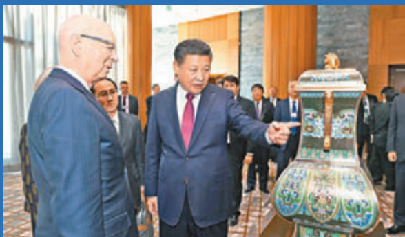
■習近平在瑞士達沃斯會見世界經濟論壇主席施瓦布，並向施瓦布介紹中國贈送給世界經濟論壇的四面方尊。

香港文匯報訊 綜合報道，中國國家主席習近平當地時間17日在瑞士達沃斯出席世界經濟論壇2017年年會開幕式並發表主旨演講，闡述走出全球經濟困境的「中國方案」。這是中國國家主席首次出席世界經濟論壇年會。習近平呼籲各國要適應和引導好經濟全球化，消解經濟全球化的負面影響，讓正面效應更多釋放出來，實現經濟全球化進程再平衡。他亦就重返貿易保護主義政策向各國發出警告，稱沒人在貿易戰中獲勝，強調貿易戰的結果只能是兩敗俱傷。