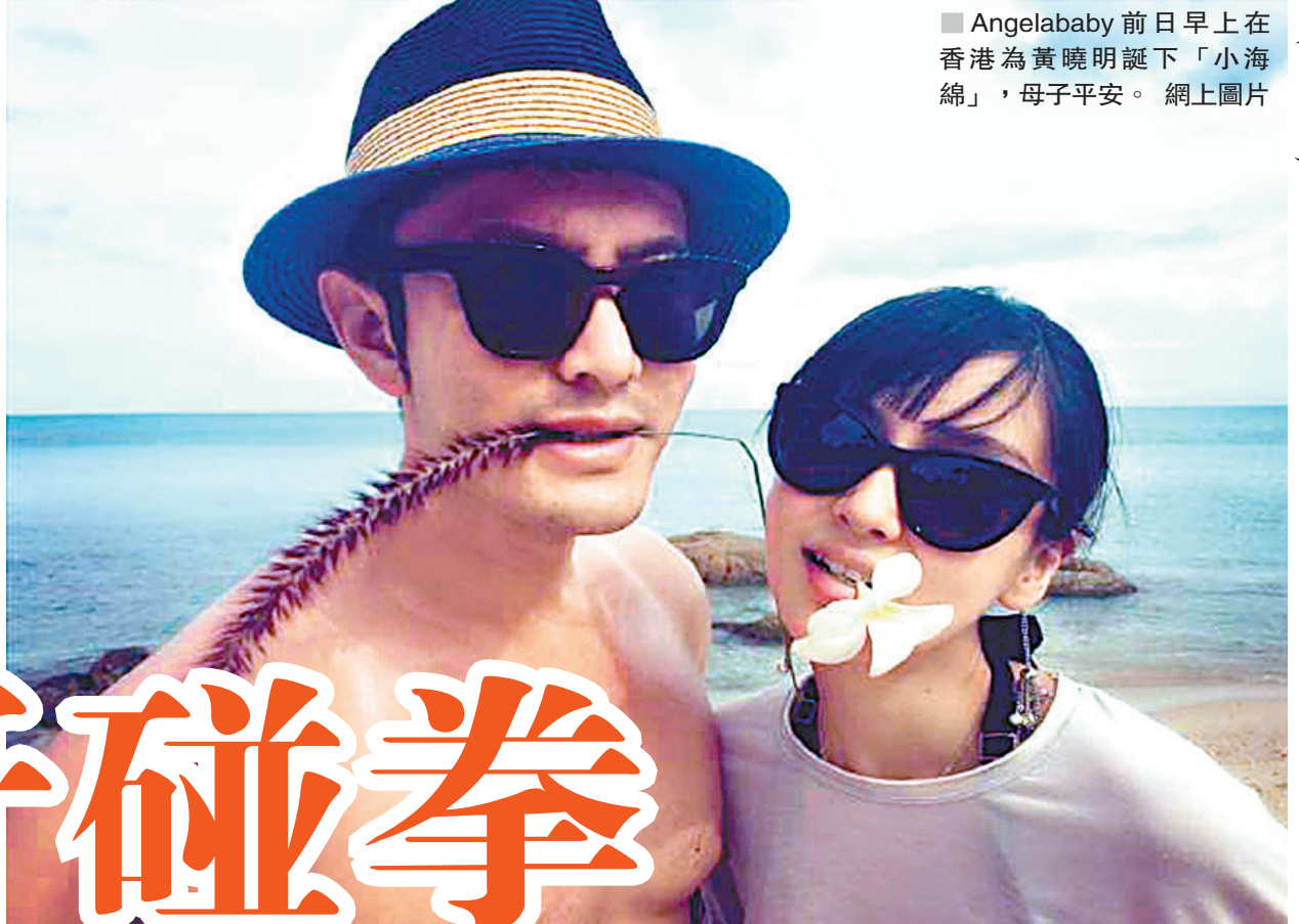
Angelababy前日早上在香港為黃曉明誕下「小海綿」，母子平安。