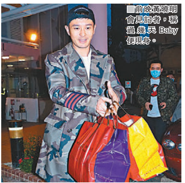
前晚黃曉明會見記者，稱過幾日Baby便現身。

香港文匯報訊 黃曉明和Angelababy的愛情結晶「小海綿」前早降臨世上，當前者透過微博公告天下後，旋即獲得海量祝福，不少更是圈中人士。其中「海綿哥哥」的商業上拍檔兼好友、女星李冰冰立即撲出來，連忙爭住要做BB契媽，她在微博上寫道：「真是說Baby，Baby就到~歡迎吸收了超強基因的小海綿！我能報名做乾媽嗎？」其餘的兩岸三地明星如古巨基、張靚穎、馮紹峰和倪妮等也紛紛留言，至於本月初才為人母的林心如則留言：「歡迎又一個小天使降臨人間~爹地要好好照顧大小Baby喔！」楊冪也是送上類似說話，她稱「恭喜曉明哥有了兩個Baby」。另一位「冰冰」范冰冰也在網上致賀：「祝福Baby和明哥！歡迎小海綿，快快樂樂健康成長！」