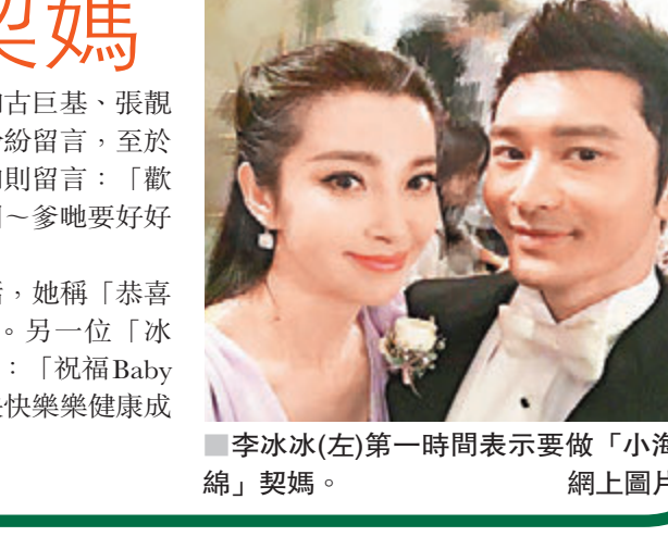
李冰冰(左)第一時間表示要做「小海綿」契媽。

香港文匯報訊 黃曉明和Angelababy的愛情結晶「小海綿」前早降臨世上，當前者透過微博公告天下後，旋即獲得海量祝福，不少更是圈中人士。其中「海綿哥哥」的商業上拍檔兼好友、女星李冰冰立即撲出來，連忙爭住要做BB契媽，她在微博上寫道：「真是說Baby，Baby就到~歡迎吸收了超強基因的小海綿！我能報名做乾媽嗎？」其餘的兩岸三地明星如古巨基、張靚穎、馮紹峰和倪妮等也紛紛留言，至於本月初才為人母的林心如則留言：「歡迎又一個小天使降臨人間~爹地要好好照顧大小Baby喔！」楊冪也是送上類似說話，她稱「恭喜曉明哥有了兩個Baby」。另一位「冰冰」范冰冰也在網上致賀：「祝福Baby和明哥！歡迎小海綿，快快樂樂健康成長！」