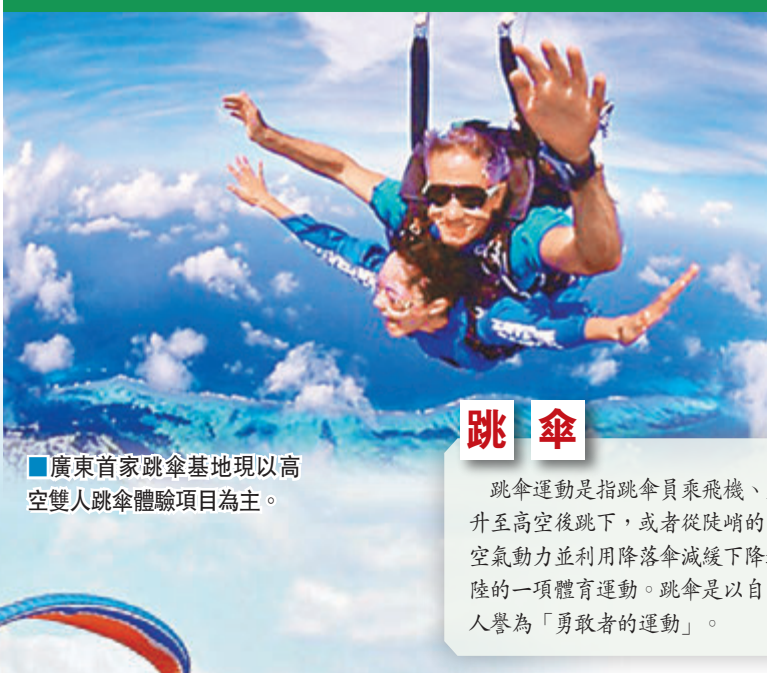
廣東首家跳傘基地現以高空雙人跳傘體驗項目為主。

博羅羅浮山滑翔傘 ：從深圳灣出發，沿東三路、東濱路經東濱沙河立交橋進入南坪快速，經梅觀立交橋到梅觀路，再進入珠三角環線高速、龍林高速到樟深路、東深路後進入S255，行駛13.4公里進入廣濟高速再到X232，1.1公里後直行進入Y539，行駛6.3公里到達，全程約2小時。