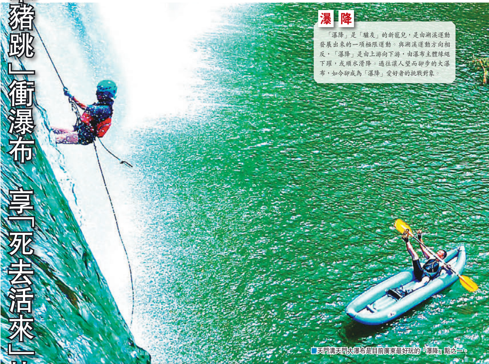
天門溝天門溝瀑布是目前廣東最好玩的「瀑降」點之一。

「瀑降」是「驢友」的新寵兒，是由溯溪運動發展出來的一項極限運動。與溯溪運動方向相反，「瀑降」是由上游向下游，由瀑布主體緣繩下墜，或順水滑降。過往讓人望而卻步的大瀑布，如今卻成為「瀑降」愛好者的挑戰對象。