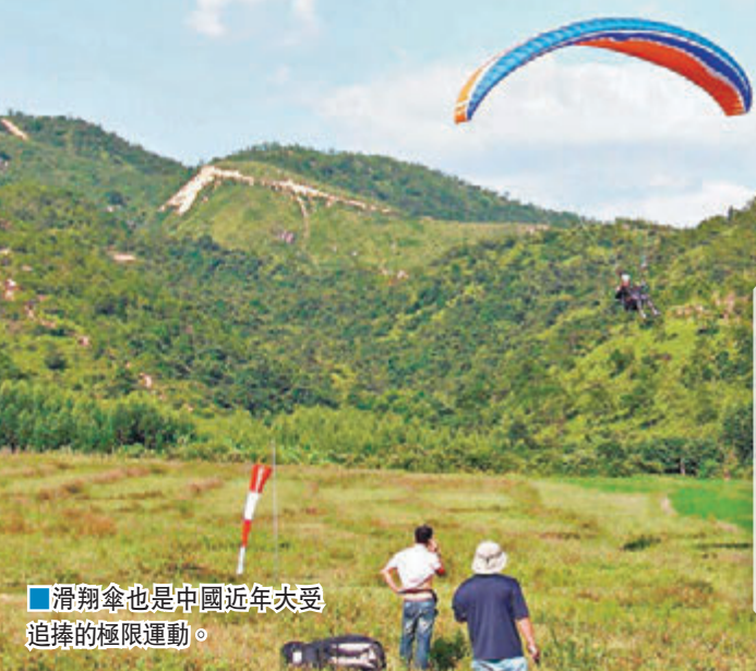
滑翔傘也是中國近年大受追捧的極限運動。

★周邊好玩推薦：羅浮山沖虛古觀、百蓮池、遇仙橋、朱明洞等 參考價格：300元/人