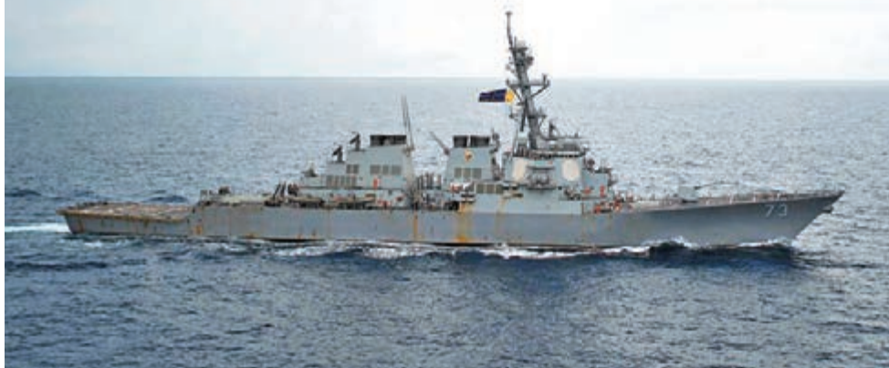
美國「迪凱特」號驅逐艦21日擅自進入中國西沙領海，遭到中國海軍兩艘軍艦警告驅離。圖為美國海軍提供「迪凱特」號近日在南海游弋的圖片。法新社

吳謙說，早在1996年5月，中國政府就公佈了《關於領海基線的聲明》，明確宣佈了西沙群島的領海基線。美方在對此完全清楚的情況下，派軍艦擅自進入中國領海，是嚴重的違法行為，也是有意的挑釁行為。中國國防部對此表示堅決反對並向美方提出嚴正交涉。