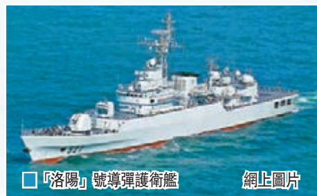
「洛陽」號導彈護衛艦 網上圖片