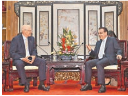
中國國務院總理李克強20日在北京會見美國前財政部長保爾森。

香港文匯報訊 據新華社報道，中國國務院總理李克強20日下午在北京釣魚台養源齋會見美國前財政部長保爾森。李克強積極評價保爾森基金會為推動中美關係發展，促進兩國務實合作方面所做工作，希望基金會繼續發揮中美友好的紐帶作用，為促進中美關係健康穩定發展作出不懈努力。