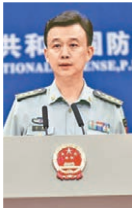
中國國防部新聞發言人吳謙資料圖片

香港文匯報訊 綜合中新網報道：據中國國防部網站消息，美國海軍「迪凱特」號驅逐艦21日擅自進入中國西沙領海。中國海軍「廣州」號導彈驅逐艦和「洛陽」號導彈護衛艦當即行動，對美艦進行識別查證，並予以警告驅離。中國國防部新聞發言人吳謙當晚就事件發表談話，他指出，軍艦擅自進入中國領海，是嚴重的違法行為，也是有意的挑釁行為。中國外交部也抨擊美國此舉嚴重侵犯中國主權和安利益，對此堅決反對並予以強烈譴責。