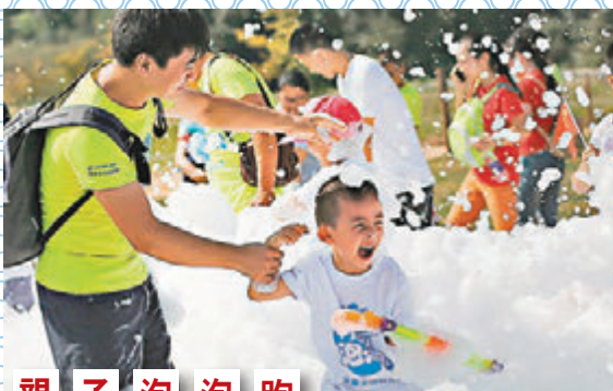
親子泡泡跑 一場主題為「激情前進」的親子泡泡跑27日在江蘇南京浦口水墨大墅舉行，吸引了3,000多位來自江蘇電台的聽眾帶著孩子前來，衝進白色的泡泡中歡樂開跑盡享快樂。 文圖：中新社

于文龍則淡然說：「救人是應該的，只是希望以後孩子們不要獨自在溪邊玩水了，大人一定要在旁邊看牢。」 ■《錢江晚報》