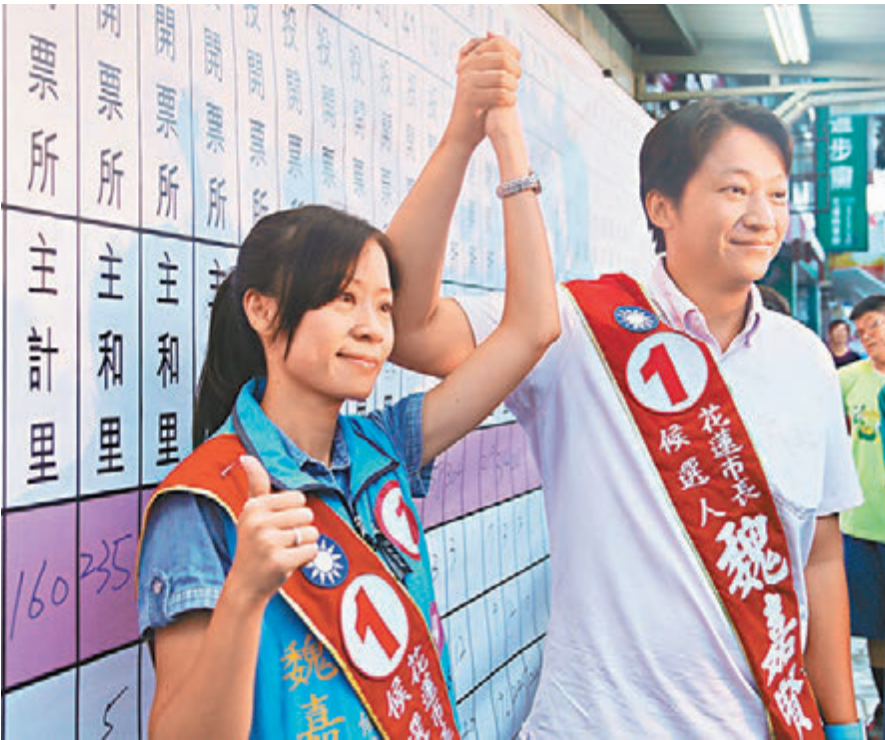
■花蓮市長補選，國民黨魏嘉賢（右）宣佈當選。圖為魏嘉賢和妻子開心宣佈當選。