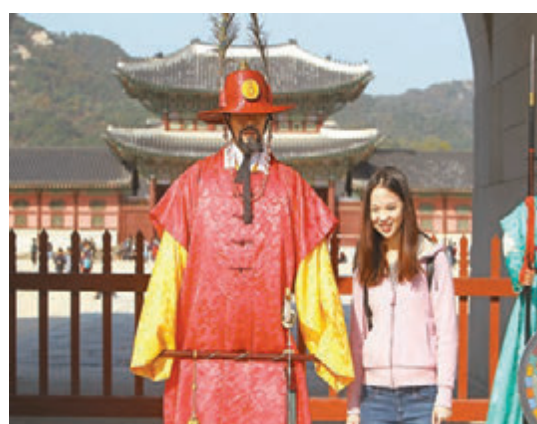
■泰韓日三國「五一」出境遊最受廣州市民追捧。圖為早前中國遊客赴韓遊玩情景。資料圖片

香港文匯報訊（記者胡若璋 廣州報道）「五一」小長假到來，對於喜歡出境遊玩的羊城遊客而言，不僅能享受小長假的愜意，還能在眾多降價出境遊產品中挑選喜歡的遊玩線路。記者了解到，泰韓日三國「五一」出境遊最受廣州市民追捧，其中部分出境遊目的地價格比去年同期下降1至3成，日韓東南亞甚至出現了國內、海外價格倒掛的情況，最低899元（人民幣，下同）就能遊日韓。記者得知，廣州市民「五一」出遊中，選擇出境遊的約有3成。