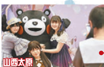
山西太原 ■第二屆Hobby Show動漫遊戲嘉年華4月30日舉行，眾多青少年體驗動漫帶來的快樂。