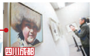
四川成都 ■西藏題材畫展4月30日舉行。