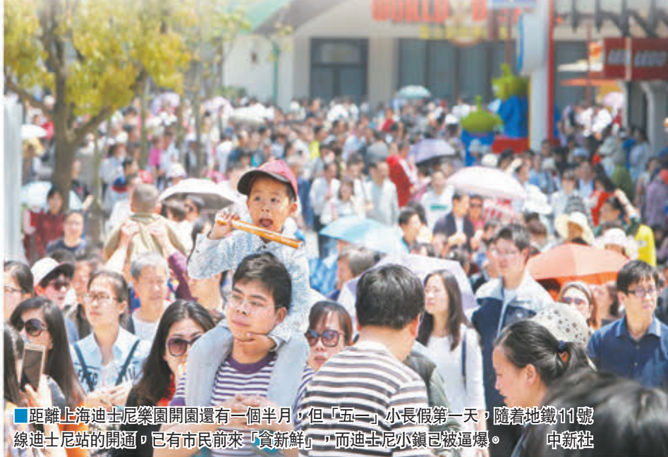
■距離上海迪士尼樂園開園還有一個半月，但「五一」小長假第一天，隨著地鐵11號線迪士尼站的開通，已有市民前來「貪新鮮」，而迪士尼小鎮已被逼爆。

有乘客認為雖然是在景區內，這一價格仍有些偏高。「這樣大小的飲料外面商店裡也就三四塊錢，這裡的價格太高了。」遊客李先生說。一名年輕的售貨員稱，自己只是按要求執行。