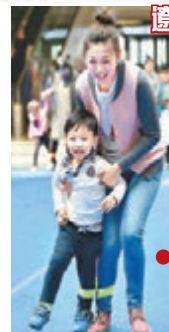
遼寧瀋陽 ■瀋陽市某幼稚園舉行一場親子運動會，家長與孩子們快樂度假。