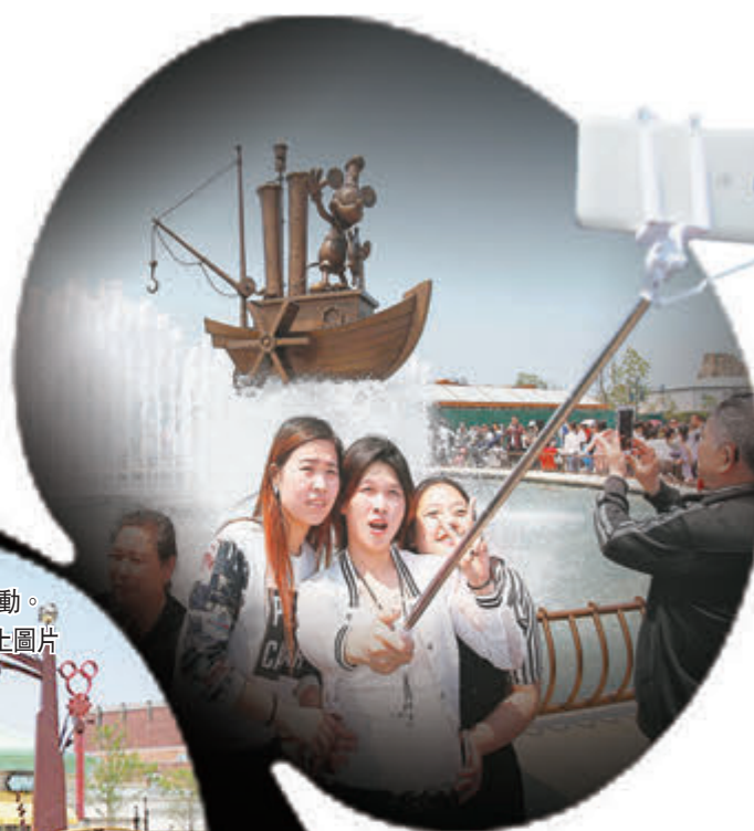
■位於上海國際旅遊度假區內的迪士尼小鎮和星願公園迎來試運行的首批大客流，不少遊人帶著「自拍神器」來到標誌性建築前拍照。

香港文匯報訊 距離上海迪士尼樂園開園還有一個半月，4月30日是中國「五一」小長假的第一天，已經有大批民眾提前體驗地鐵和樂園的歡樂。地鐵方面預測，「五一」小長假期間，迪士尼站單日進出站客流或將超過12萬人次。