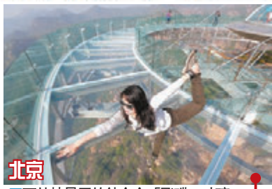
北京 ■石林峽景區的鈦合金「飛碟」玻璃觀景台4月30日正式迎客。