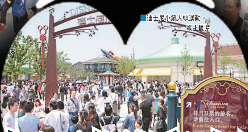
■迪士尼小鎮入園湧動。網上圖片