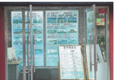
■天安門周邊出現的「一日遊」低價「旅行社」。

針對「黑導遊」頑疾，各地紛紛亮劍，為規範當前旅遊市場，今年以來至少8省份通過修改本省旅遊條例對旅遊市場進行治理，有的已經或即將實施，有的處於提請審議、徵求意見的階段。浙江、河北、重慶等省份均對導遊強迫或誘導遊客消費等行為亮出高罰