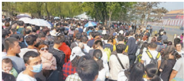
■「黑導遊」經常在早晨6點半前拉客。圖為4月30日人潮擁擠、排隊等待安檢進入天安門廣場的遊客們。

此間專家指出，「黑導遊」、「天價飯菜」等旅遊亂象不僅需要行政管理部門進行管理，也要輔之以相關法律法規的完善。此外，專家認為，旅遊亂象與當前中國旅遊業發展不成熟也有關係，無論是整個旅遊市場管理，還是旅遊市場本身發展水平以及從業人員的職業素養，距離成熟階段均尚需時日。