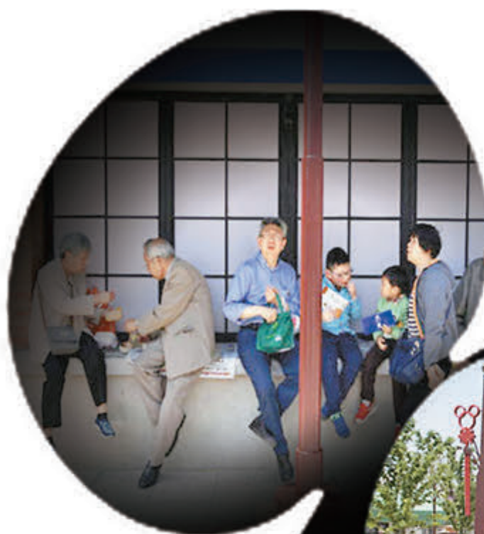
■由於迪士尼小鎮還沒有安裝座椅，不少遊客唯有坐在窗邊休息。

香港文匯報訊 距離上海迪士尼樂園開園還有一個半月，4月30日是中國「五一」小長假的第一天，已經有大批民眾提前體驗地鐵和樂園的歡樂。地鐵方面預測，「五一」小長假期間，迪士尼站單日進出站客流或將超過12萬人次。