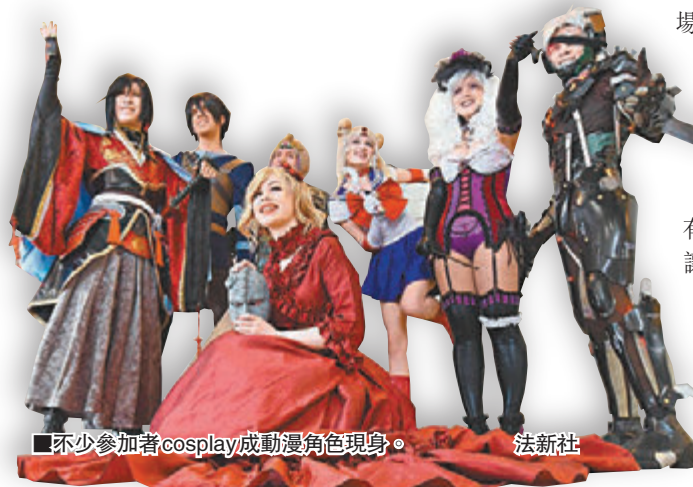
■不少參加者cosplay成動漫角色現身。

日本動漫文化風靡全球，不僅成為日本本地重要產業之一，更是拓展外交軟實力的重要途徑。為進一步開拓有關市場，日本28日起一連兩天在東京舉辦號稱全球首屆「御宅族峰會」，更首次邀請外國團體參與，吸引40多個來自18個國家及地區的「御宅族」組團出席，不少人更cosplay成自己喜愛的動漫角色現身，場面非常熱鬧。