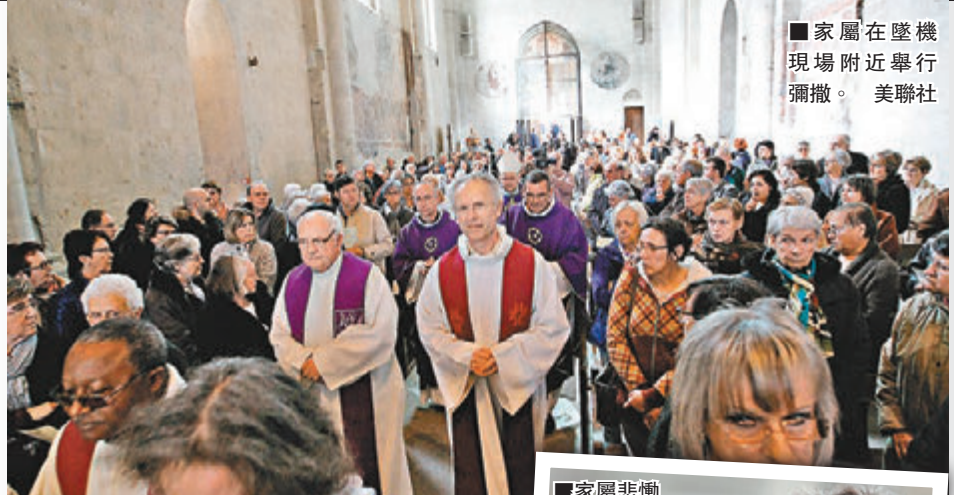
■家屬在墜機現場附近舉行彌撒。