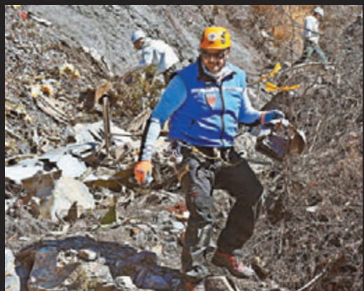
■當局繼續在墜機現場搜索。