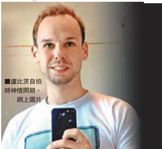
■盧比茨自拍時神情開朗。