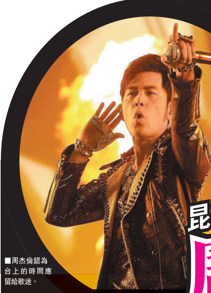
周杰倫認為台上的時間應留給歌迷。