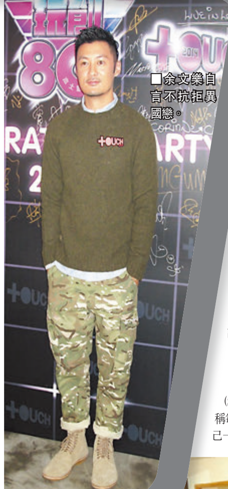
余文樂自言不抗拒異國戀。