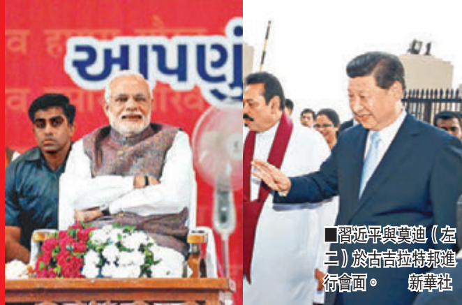
■習近平與莫迪（左二）於古吉拉特邦進行會面。

香港文匯報訊 綜合報道，中國國家主席習近平昨日訪問印度之行是中國國家元首時隔8年再度訪印，也是印度新政府成立後接待的第一位大國元首。「中國能量」和「印度智慧」的結合定將釋放出巨大潛能。「中國龍」和「印度象」的強強聯合，聯袂共舞，不僅將造福中印，也定將惠及亞洲和世界。中國駐印度大使表示，中印兩國有望在貿易、投資、金融、基礎設施等領域簽署近20項合作協議。