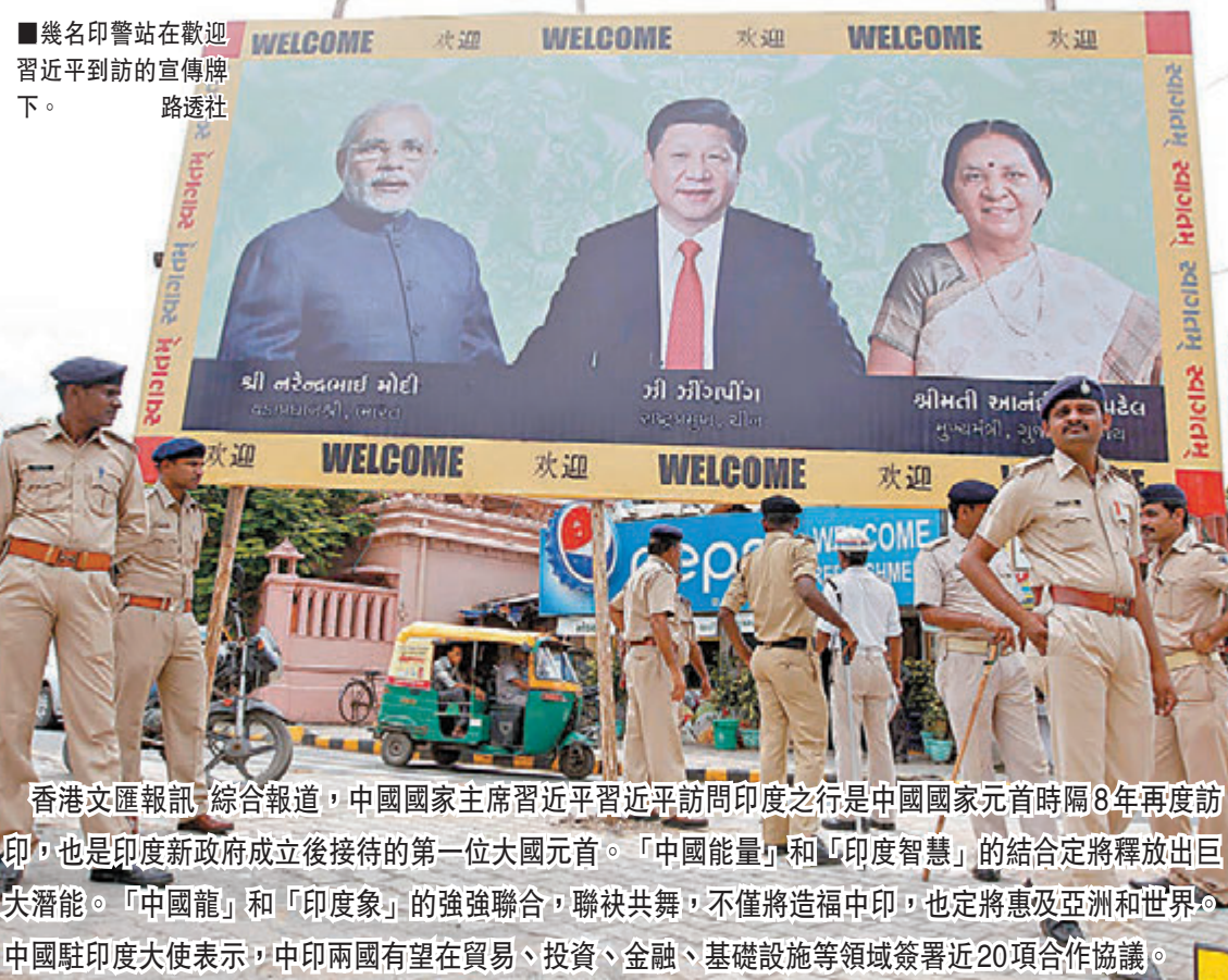
■幾名印警站在歡迎習近平到訪的宣傳牌下。