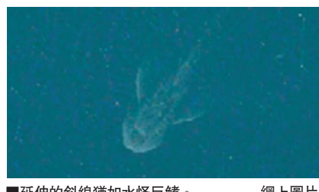
■延伸的斜線猶如怪巨鱗。網上圖片

波瀾面積龐大，長達100呎，兩邊呈斜直線延伸，恰似水怪伸出的巨鱗。有水怪發燒者指波瀾不似由巨輪造成，潛艇亦不會在湖底執行任務，很可能是水怪藏身湖底。 ■《每日郵報》