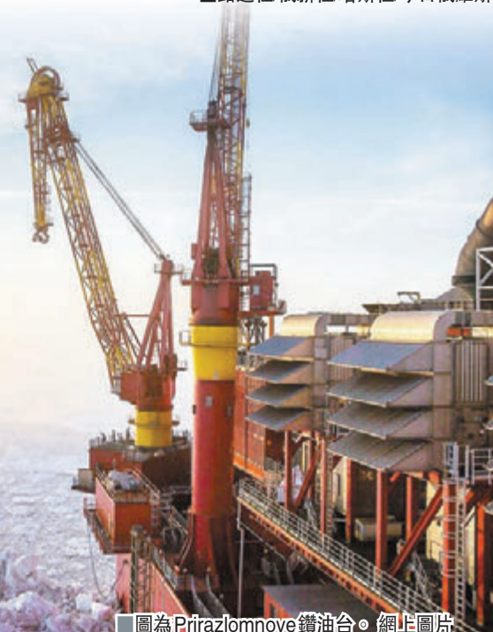
■圖為Prirazlomnoye鑽油台。

不過環保團體強烈反對各國開採北極資源，30名綠色和平示威者去年更闖入Prirazlomnoye鑽油台而被俄羅斯當局