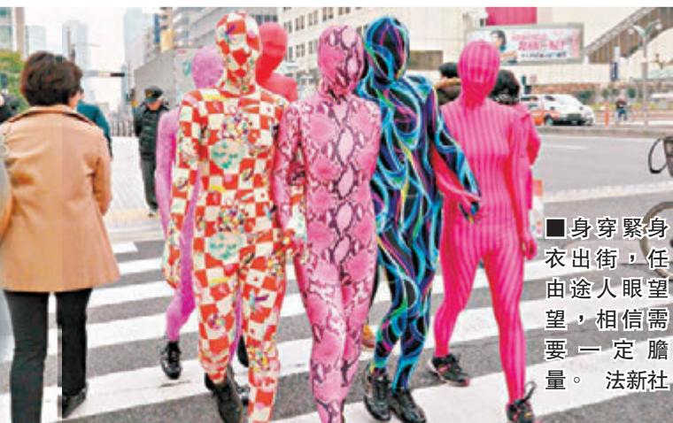
身穿緊身衣出街，任由途人眼望，相信需要一定膽量。

20多歲的「北極二號」開時是典型保守OL，晚上變身「緊身衣人類」去酒吧消遣。她說：「我這輩子都在擔心外界眼光，大家都說我溫柔又天真，但這讓我喘不過氣。」她認為穿上全包緊身衣有助她忽略外界批評，獲得解放。