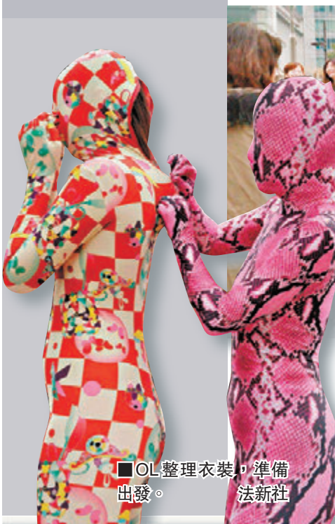
OL整理衣裝，準備出發。