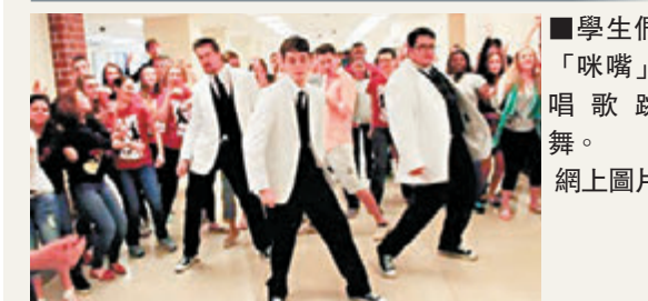
學生們「咪嘴」唱歌跳舞。