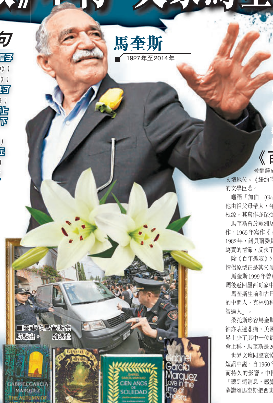
靈柩從馬奎斯寓所駛出。