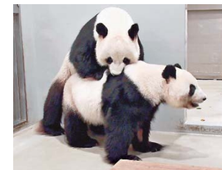
盈盈及樂樂。

驗尚淺, 故未能成功進行自然交配而要進行人工受孕。有別於往年採用樂樂混合新鮮及冷凍的精液為盈盈進行人工授精, 今年海洋公園從樂樂身上成功收集到數量充足而又高質的新鮮精液為盈盈進行人工授精。一般來說, 新鮮精液的質量較冷凍精液好, 所以懷孕成功率亦相對較高。