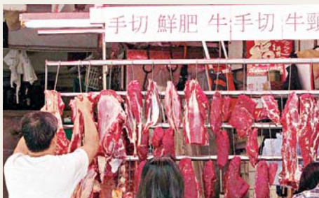
五豐行表示, 活牛成本不斷上升, 所以分開8次加價。中通社