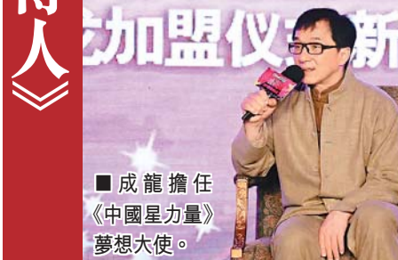
■成龍擔任《中國星力量》夢想大使。

近日李思捷主持的整蠱節目《玩嘢王》令到藝員有如驚弓之鳥，翠如BB笑言有日在沙灘拍攝，都會即時望草堆內可有攝影機。唯唯亦笑指日前返公司出席活動時，都有在想是否在拍《玩嘢王》最後一集，更諗思捷是否連TVB高層都玩？