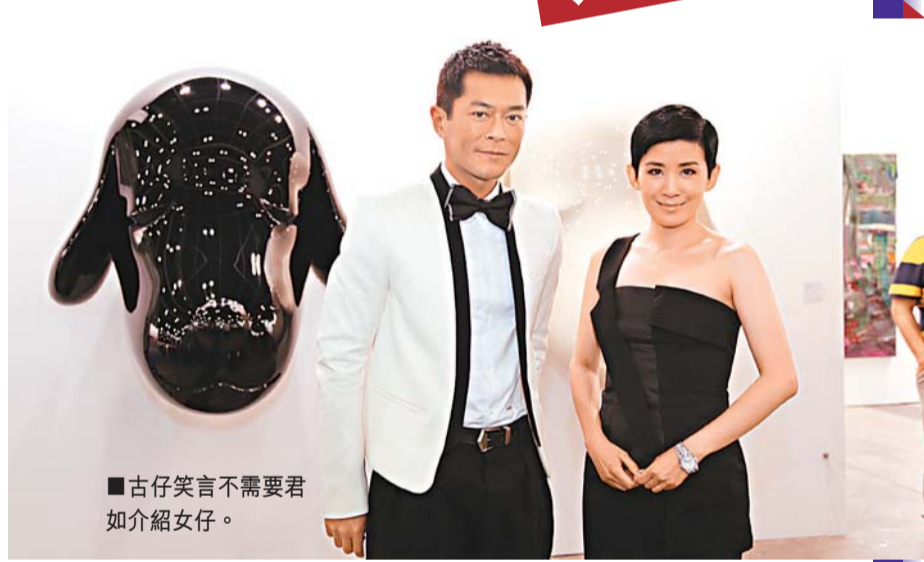
■古仔笑言不需要君如介紹女仔。

父親節將至，古仔透露會送上手錶給父親，因為母親節他也是送手錶給媽咪，而且他七、八歲時收到第一隻錶都是爸爸送的，是一隻紅色米奇老鼠膠錶，相信現時是成古董了。